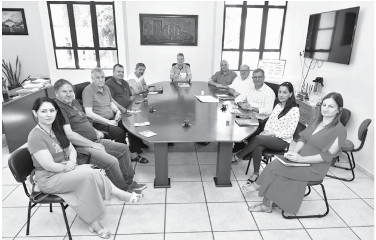
Reunião de prefeitos em São Miguel das Missões

Prefeitos da AMM - Associação dos Municípios das Missões discutem a formalização de um sistema de cooperação para o turismo. Essa proposta envolve os municípios que se desenvolveram nas proximidades das reduções Jesuíticas do Lado Oriental do Rio Uruguai: Santo Ângelo, São Miguel das Missões, Entre-Ijuís, São Luiz Gonzaga (Redução de São Lourenço), São Nicolau e São Borja. O consórcio será aberto a participação dos demais municípios afiliados à associação (AMM)