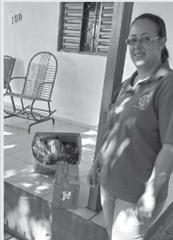
09/03/2023 - Doação de alimentos e vale gás.