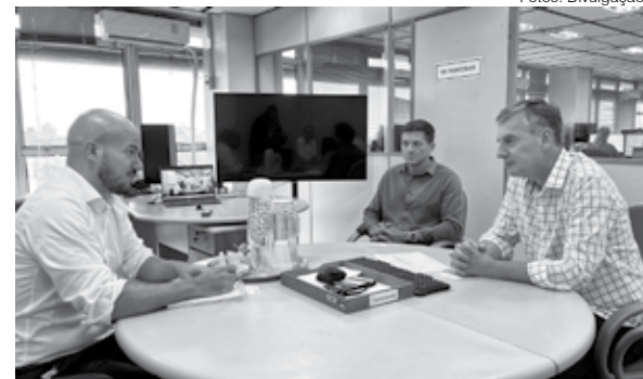
Pedro Capeluppi e Eduardo Loureiro

Na próxima quinta-feira, dia 16, lideranças e entidades terão oportunidade de debater o futuro do Aeroporto Regional de Santo Ângelo. Em encontro na Câmara de Dirigentes Lojistas (CDL) a partir das 16 horas, o secretário estadual de Concessões e Parcerias Pedro Capeluppi apresentará os planos do governo para o aeródromo e ouvirá as ideias da comunidade sobre o tema.