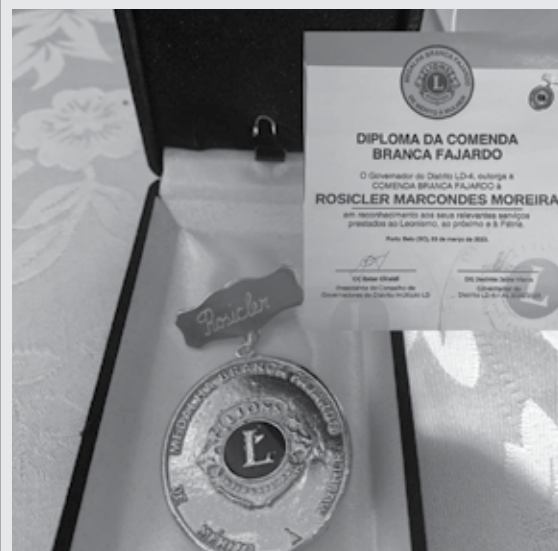
11/03/2023 - III RGD - Uma Companheira do Lions Universitário recebeu uma Comenda em reconhecimento aos serviços prestados ao Leonismo.