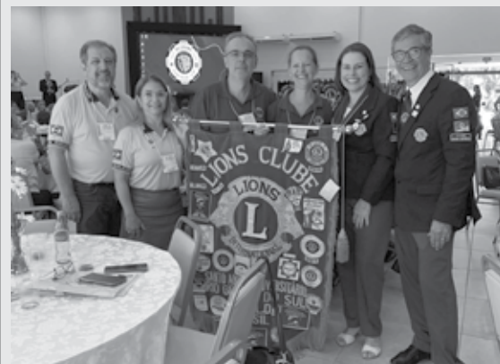
11/03/2023 - Nosso Clube participou da III RGD, em São Pedro do Sul.