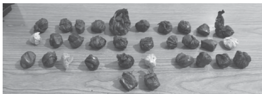
Conteúdo das sacolas apreendidas próxima ao Presídio Regional de Santo Ângelo

atitude suspeita, com eles, foi localizado e apreendido 11 pedras de entorpecente crack e mais R$ 92,50. Diante do fato foi dada voz de prisão e conduzido