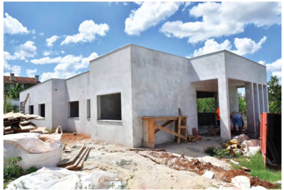
Obra do Centro de Referência Especializado de Assistência Social (CREAS)

As obras de alvenaria estão em fase final de conclusão. O investimento é de R$ 541.673,85 para atendimento ao público dos bairros Aliança, São Pedro e comunidades adjacentes.