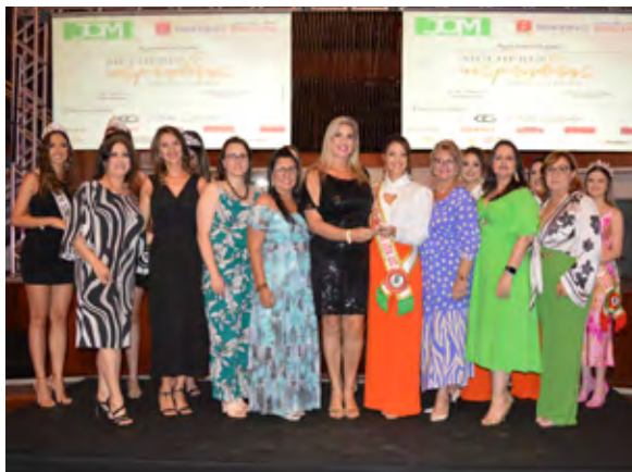
Diretoria Feminina do Clube Gaúcho