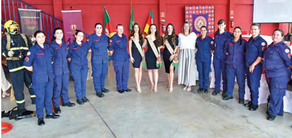
Sede do 11º Batalhão de Bombeiros Militar (BBM) durante o 1º Encontro Mulheres Pela Vida

Na véspera do Dia Internacional da Mulher, o 1º Encontro Mulheres Pela Vida foi realizado na manhã desta terça-feira, 7, na sede do 11º Batalhão de Bombeiros Militar (BBM). As profissionais da segurança pública foram homenageadas, acompanharam palestras e participaram de atividades de cuidados pessoais.