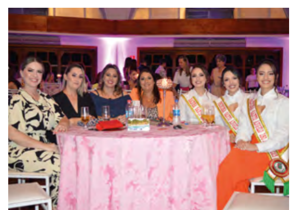
Comissão de Divulgação do Baile dos 150 anos