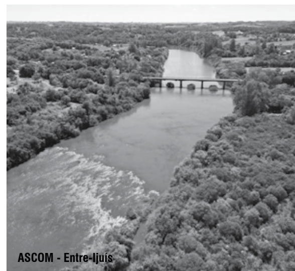
ASCOM - Entre-Ijuís

Estima-se que durante o período das missões jesuíticas estes locais de passagem eram usados pelos indígenas que vinham de São João Batista para Santo Ângelo. Conhecido como Passo do Ijuí é um local folclórico para os missionários, tendo em vista que faz parte de fatos históricos relacionados aos Sete Povos das Missões, o local também teria servido para a passagem das tropas de mulas e de gado.