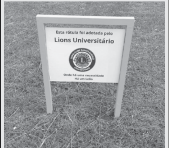
01/02/2023 - Renovação da placa que fica na rótula que adotamos, na Getúlio Vargas com a Tiradentes.