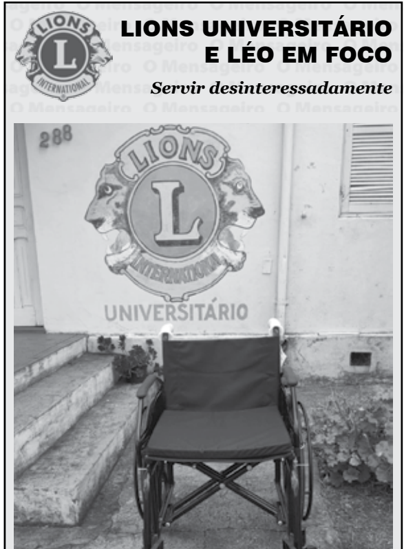
31/01/2023 - Empréstimo de nosso Banco Ortopédico.

Atualmente, a da Associação de Produtores Hortigranjeiros e Produtos Coloniais de Santo Ângelo (APROCOHSA), conta com 18 famílias que semanalmente expõem e comercializam seus produtos junto a Feira do Produtor rural.