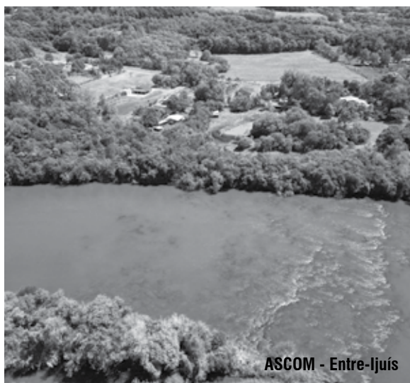
ASCOM - Entre-Ijuís