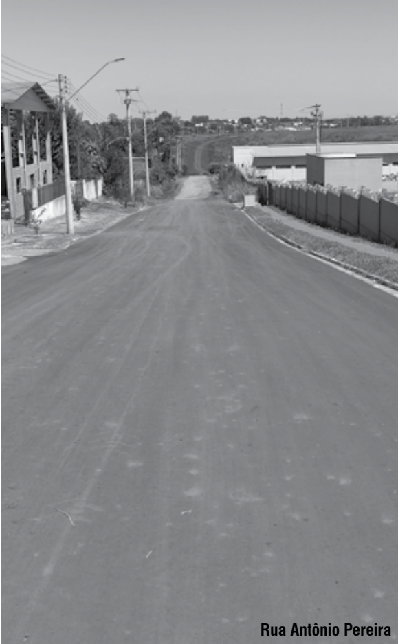
Rua Antônio Pereira

A pavimentação da Rua Antônio Pereira deve qualificar a ligação entre a zona norte de Santo Ângelo com a AV. Sagrada Família. Esse projeto está em processo de execução e as imagens de satélite do Google Earth já permitem observar por onde segue o novo itinerário que promete encurtar o caminho entre o distrito industrial e a Avenida Salgado Filho, no trecho que fica entre os condomínios Margarida e Terra Missões