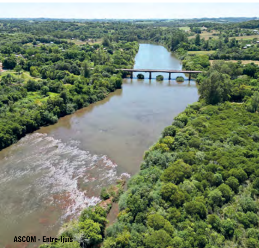
ASCOM - Entre-Ijuís