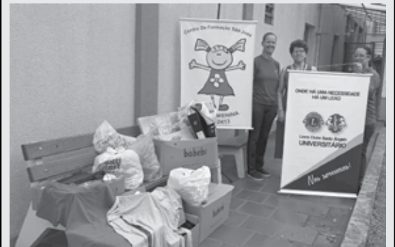
01/02/2023 - Doação de roupas, calçados, enfeites pra casa e escovas de dentes infantis para o Lar da Menina.