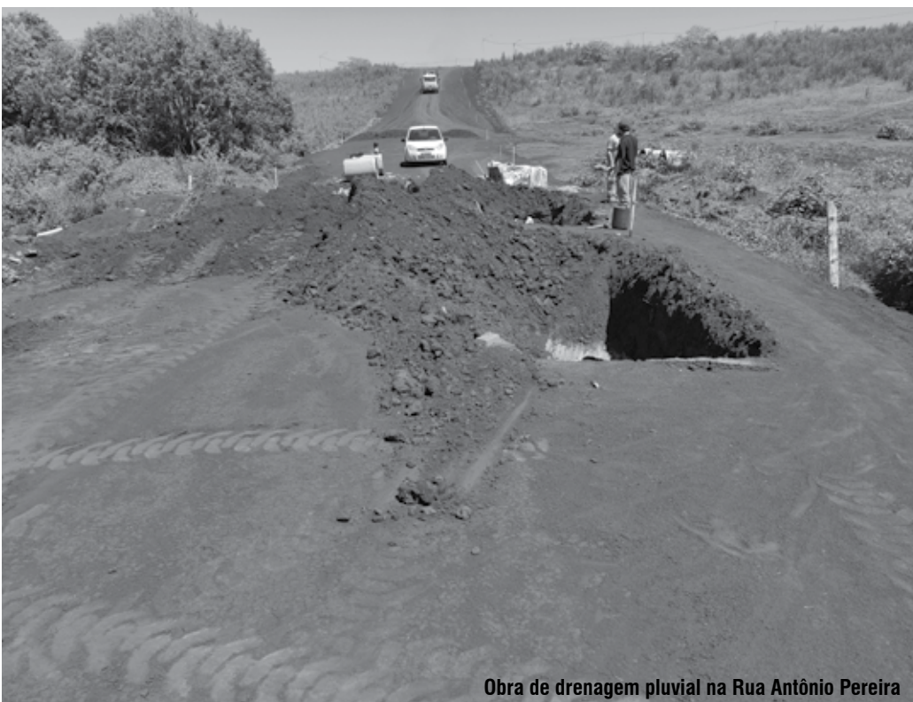
Obra de drenagem pluvial na Rua Antônio Pereira

No segundo semestre do ano passado a assessoria de imprensa da prefeitura divulgou que o chefe do Executivo autorizou o processo de tomada de preço para a elaboração do projeto de engenharia visando a construção de um contorno viário ligando a ERS 218 a ERS 344, via perimetral norte, com o prolongamento das avenidas Getúlio Vargas e Tarumã, passando em trecho da estrada de acesso ao Distrito Sossego, margeando o Distrito Industrial Hans Pfaff e o Instituto Federal Farroupilha (IFFar).