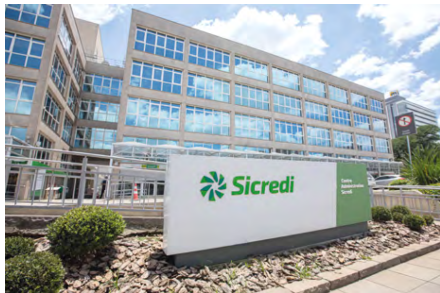
Centro administrativo da Sicredi, em Porto Alegre

Rural, atual Sicredi Pioneira, na comunidade de Linha Imperial - em 1902 na cidade de Nova Petrópolis -, e marcou também o início do cooperativismo de crédito no Brasil, a partir da motivação do Padre Theodor Amstad e de lideranças da comunidade.