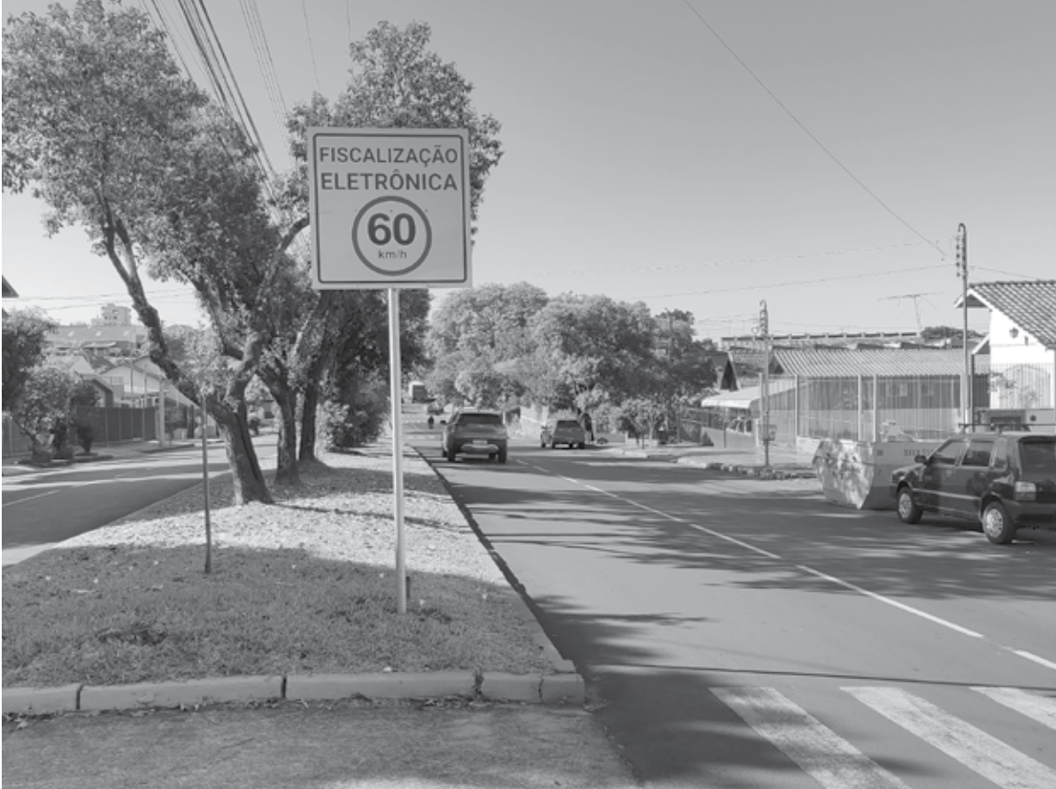
Avenida Getúlio Vargas

DMT – Departamento Municipal de Trânsito realiza o trabalho de implantação de placas indicativas de velocidade máxima permitida e o respectivo aviso do controle de fiscalização eletrônica. Principalmente nas vias de acesso rápido de Santo Ângelo, como nas Avenidas Getúlio Vargas, Salgado Filho e Ipiranga. O limite é de 60 km/h