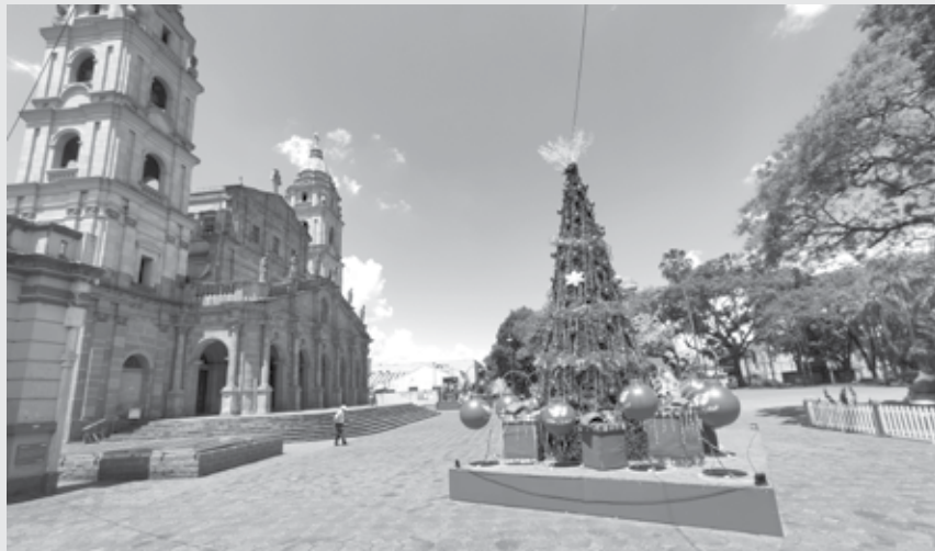
Início da montagem da arena em frente a Catedral Angelopolitana

O Vilarejo Cidade dos Anjos no Centro Histórico; Prenúncio dos Anjos, Cortejo Celestial e Desfile Encantado, nas ruas centrais, Caravana do Papai Noel, nos bairros; Casa do Papai Noel na Praça Leônidas Ribas Dindin, que ligará as praças do Brique e da Catedral.