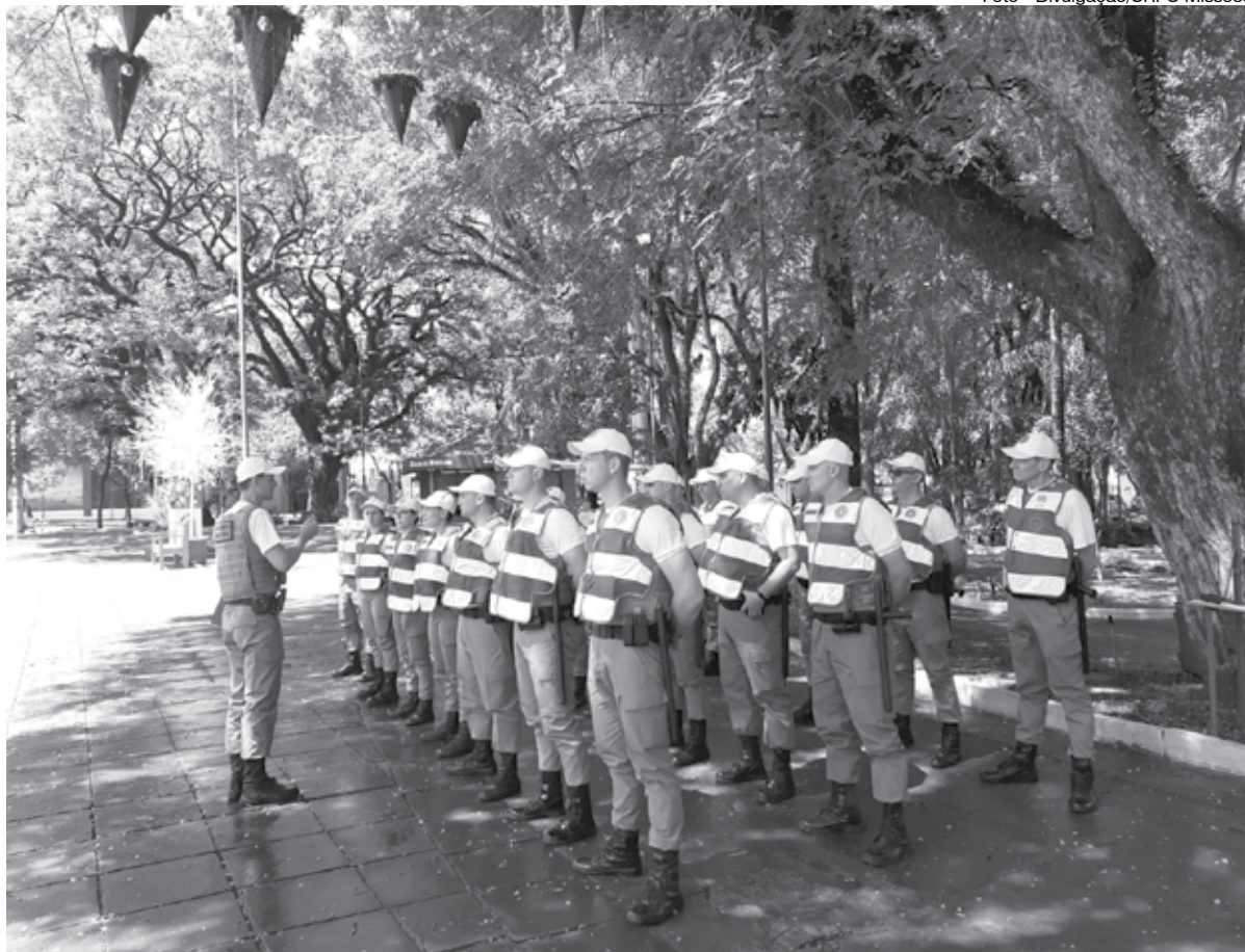
Início da montagem da arena em frente a Catedral Angelopolitana

A presença de policiais da Brigada Militar nas ruas de Santo Ângelo foi intensificada no último final de semana. Os Alunos Sargentos atuaram em diversos pontos da cidade, tanto na área central quanto em bairros, realizando barreiras de fiscalização de veículos e identificação de pessoas, desenvolvendo ações articula-