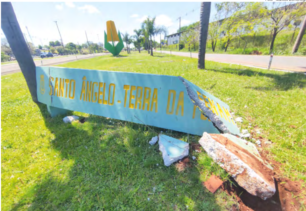
Trevo da Fenamilho

A inscrição de concreto que identifica Santo Ângelo como Terra da Fenamilho foi destruída por um automóvel, as marcas dos pneus e os estilhaços ainda podem ser vistos no local, que fica em um dos acessos principais do Município.