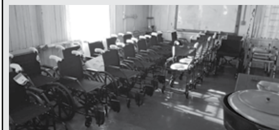
18/10/2022 - Cadeiras de rodas e de banho, recebidas através do Fundo Social Siciedi. Nosso Banco Ortopédico está sendo ampliado para melhor servir à quem precisa.