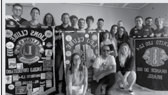
23/10/2022 - Visita do Gabinete do Distrito LEO LD4 ao nosso LEO Clube Santo Ângelo Universitário.

Empresa Jornalística JOM Ltda. CNPJ 30.160.583/0001-89