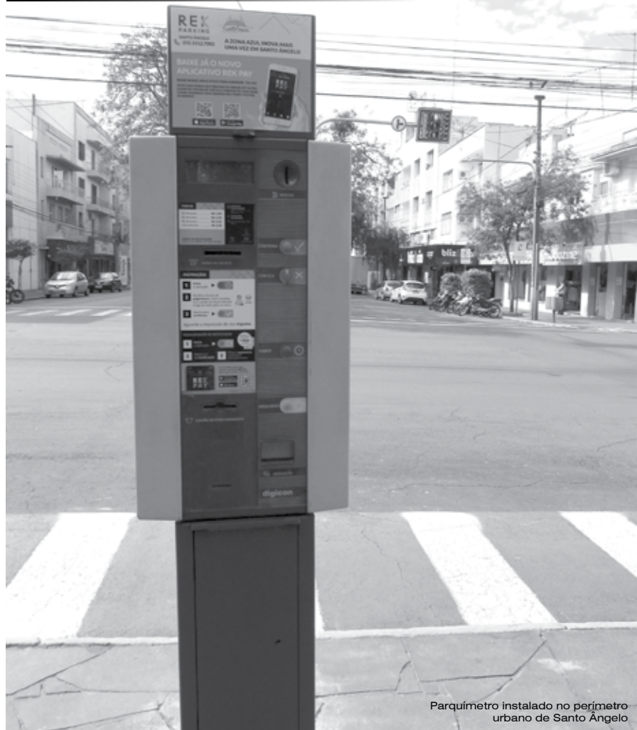
Parquímetro instalado no perímetro urbano de Santo Ângelo