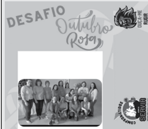
22/10/2022 - Dia de participar da campanha online de nosso LEO Clube, em alusão ao Outubro Rosa.