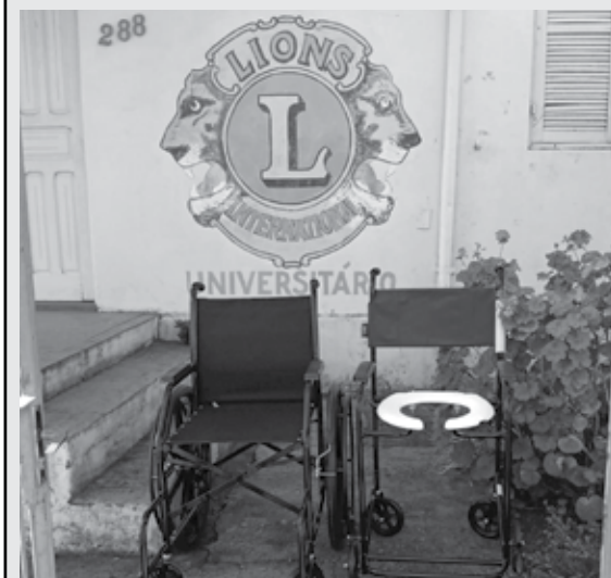
18/10/2022 - Empréstimo de uma cadeira de rodas e uma de banho para o curso de psicologia, para um treinamento sobre inclusão social.