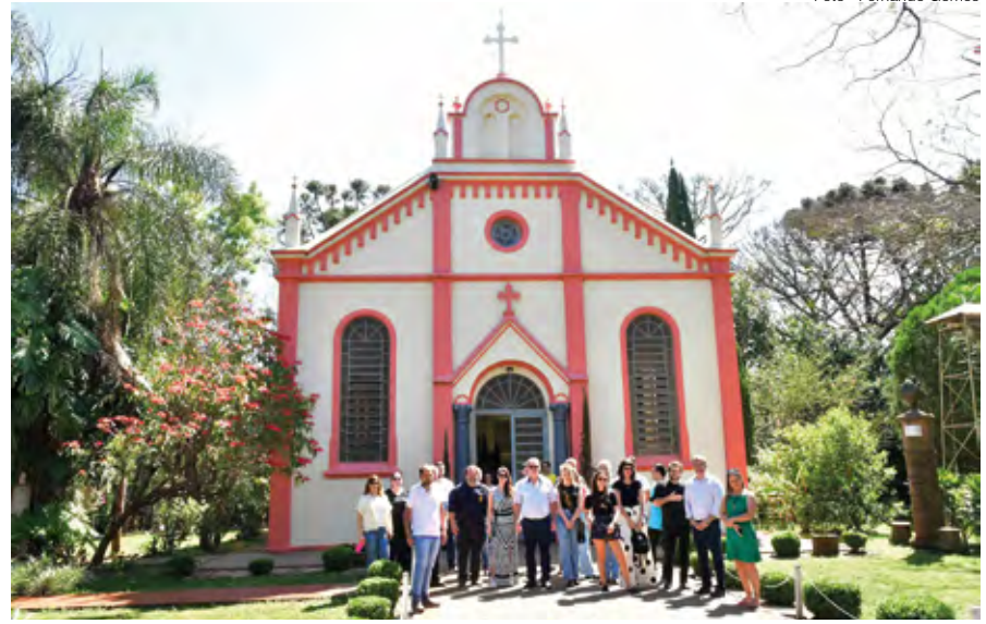
Visita ao Santuário de Caaró