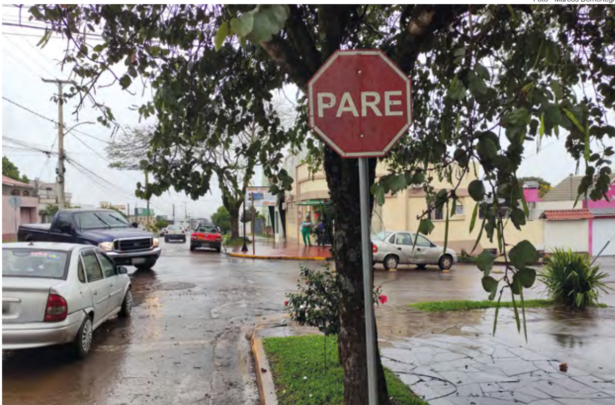
Cruzamento da Rua Tiradentes com a 15 de Novembro

Motoristas que transitam pela Rua Tiradentes presumem existir pouco movimento na Rua Quinze de Novembro e não respeitam a sinalização de "Pare". Por conta disso, dois acidentes em menos de 30 dias ocorreram nesse mesmo cruzamento, um deles ocasionou em danos materiais e um segundo em danos materiais e lesões corporais.