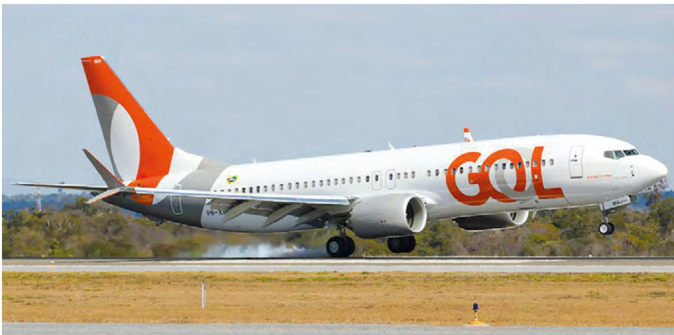
Boeing da Gol

17h50: pronunciamento de autoridades e representantes da GOL.