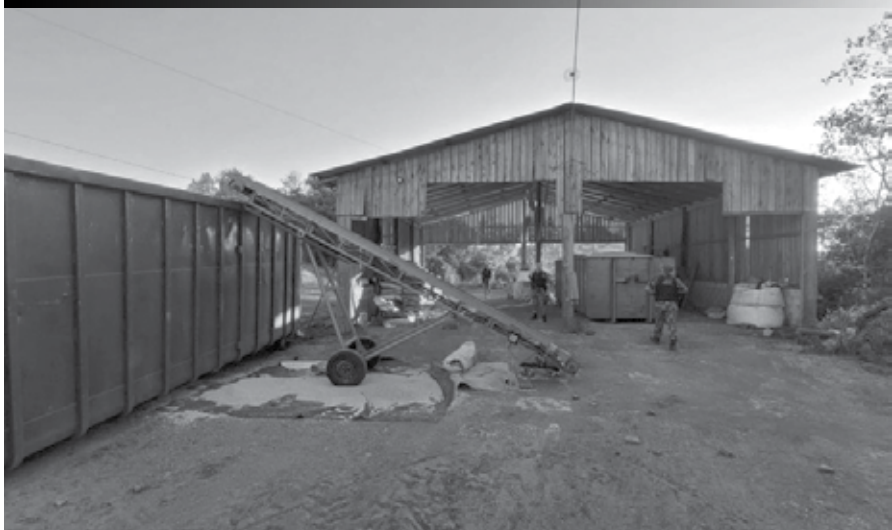
Foram apreendidos dois tratores com guinchos hidráulicos, caçambas entre outros equipamentos e veículos