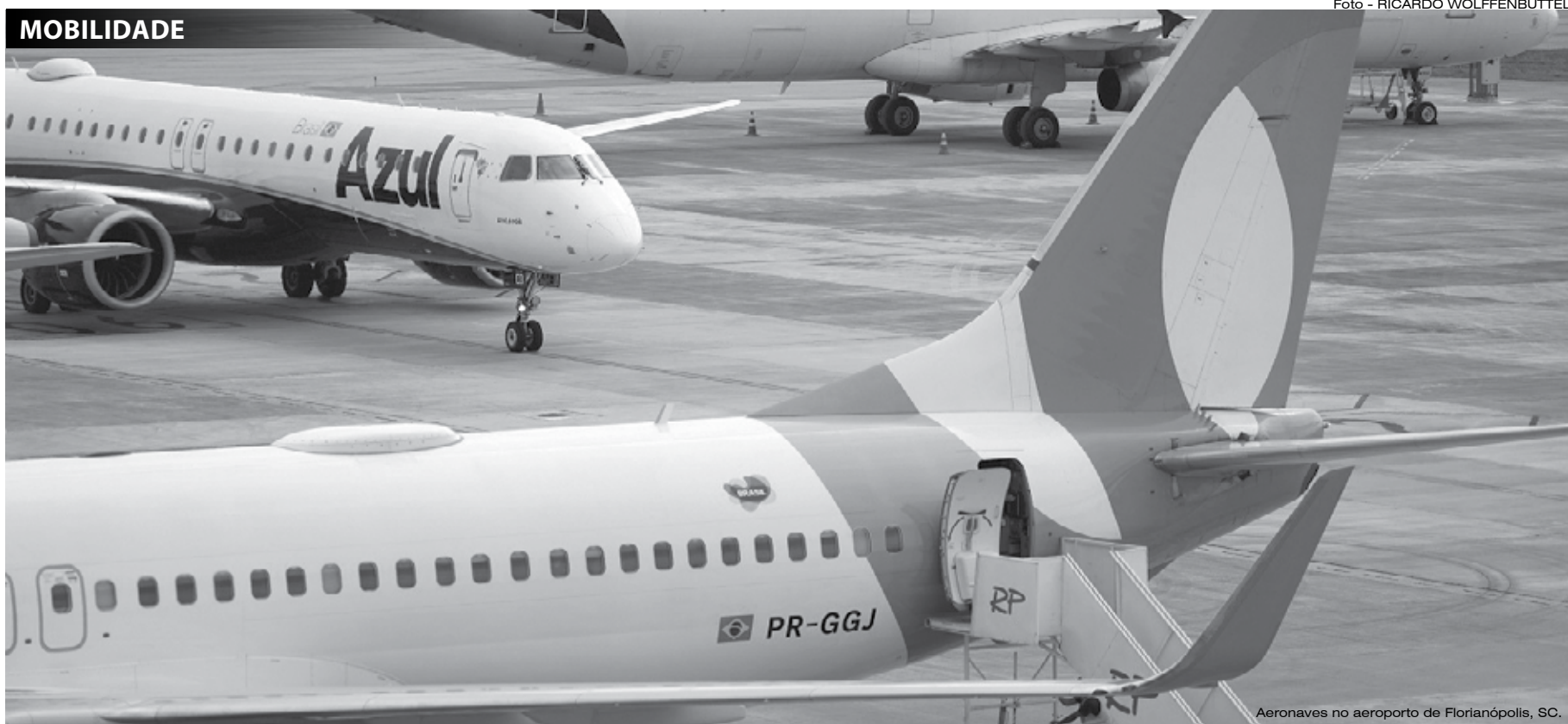
Aeronaves no aeroporto de Florianópolis, SC.