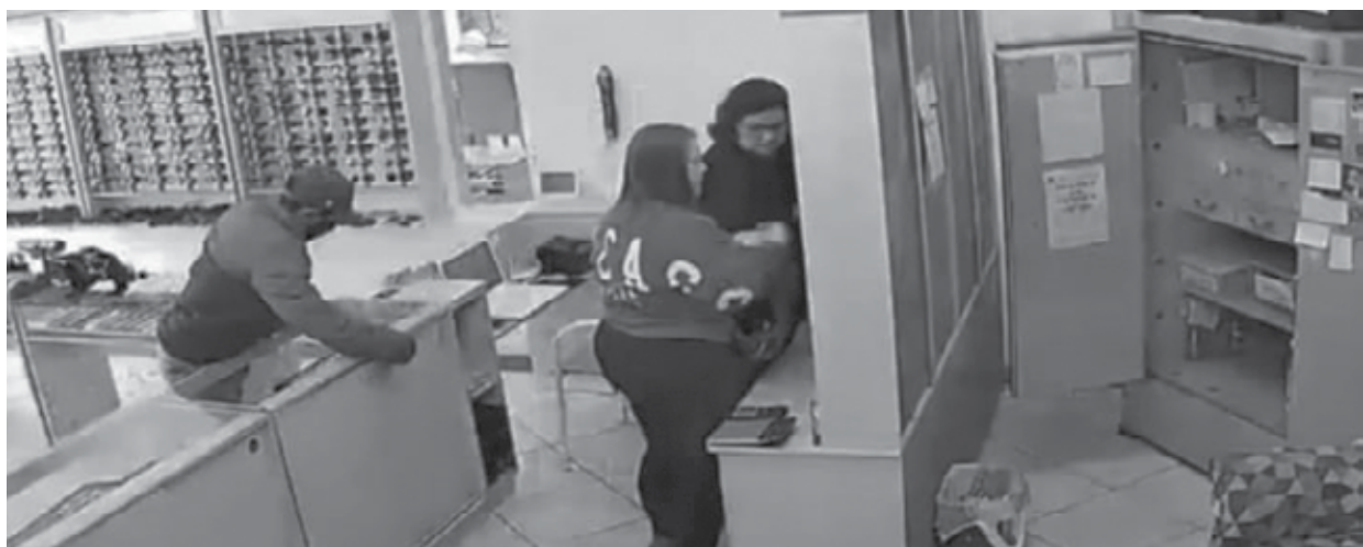
Imagem: Reprodução das câmeras de segurança no momento do assalto

Universal Ótica e Relojoaria localizada no calçadão da Rua 25 de Julho foi vítima de dois assaltantes. O assalto foi realizado no momento em que o estabelecimento estava sendo aberto pelas funcionárias da loja, por volta das 8h30min