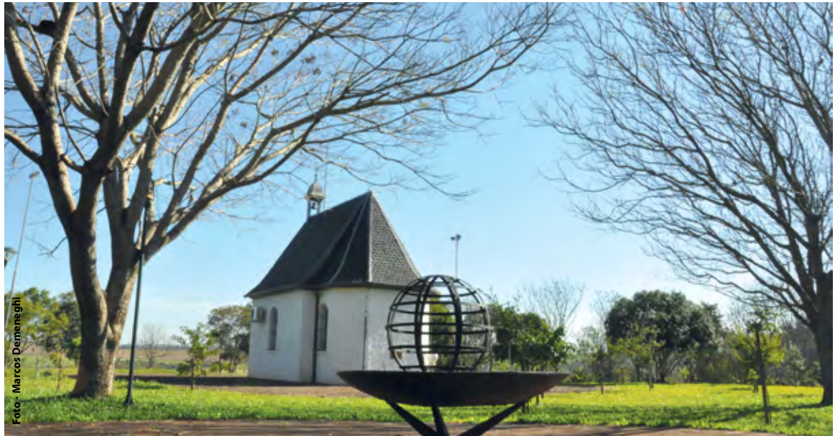
Capela do Santuário de Schoenstatt em Santo Ângelo

Romaria de Schoenstatt deve reunir cerca de cinco mil pessoas em uma caminhada do centro de Santo Ângelo até o Santuário Mariano de Schoenstatt - Tabor Missioneiro Tupancirendá. Será neste dia 12 de outubro e o percurso iniciará às 8h da manhã, envolve fiéis da fé católica e o tempo de percurso da caminhada é estimado em 1h45min.