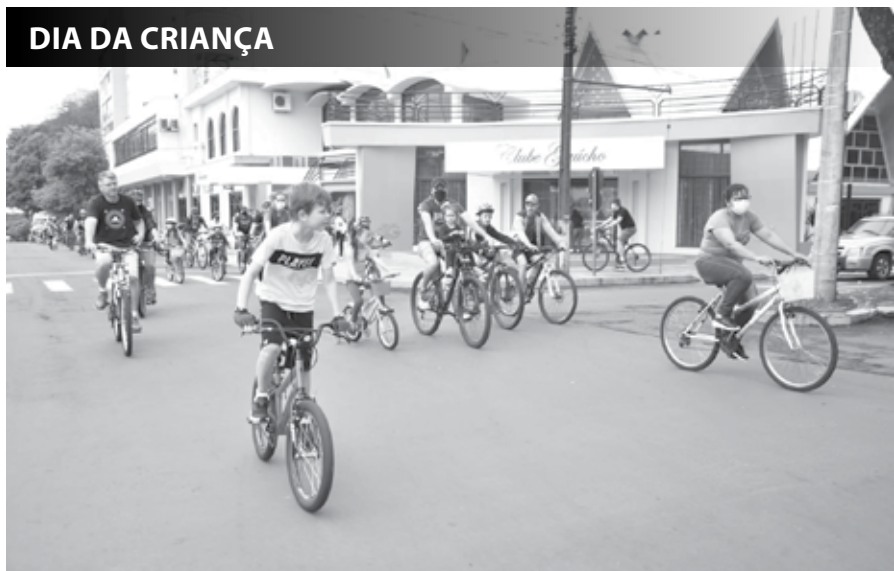
Fotos da edição anterior do evento e divulgadas nos canais do Clube Gaúcho