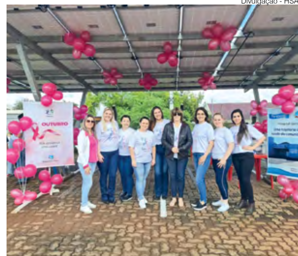
Equipe do Hospital Santo Ângelo

A programação do Outubro Rosa no município iniciou no último sábado, dia 1º com uma ação comunitária realizada na UPA e segue até o final do mês com uma agenda de ações que tem o propósito de promover a conscientização de prevenir, diagnosticar e tratar as patologias relacionadas ao câncer feminino.