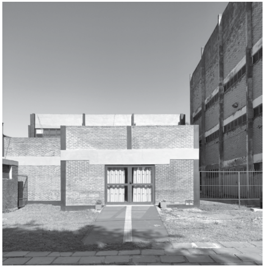
Nova sede da ASLE