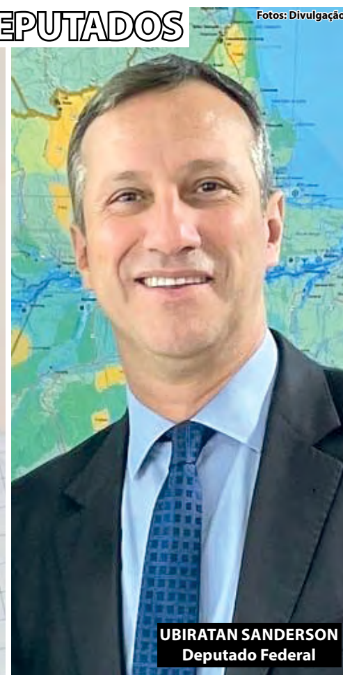
UBIRATAN SANDERSON Deputado Federal

Os candidatos santo-angelenses conquistaram vagas no legislativo, EDUARDO LOUREIRO - pela terceira vez é eleito Deputado Estadual e UBIRATAN SANDERSON - novamente é Deputado Federal. Ao Eduardo e ao Sanderson, parabéns e que continuem priorizando os interesses do bem comum, em especial a Capital das Missões. Sucesso em todas as suas iniciativas.