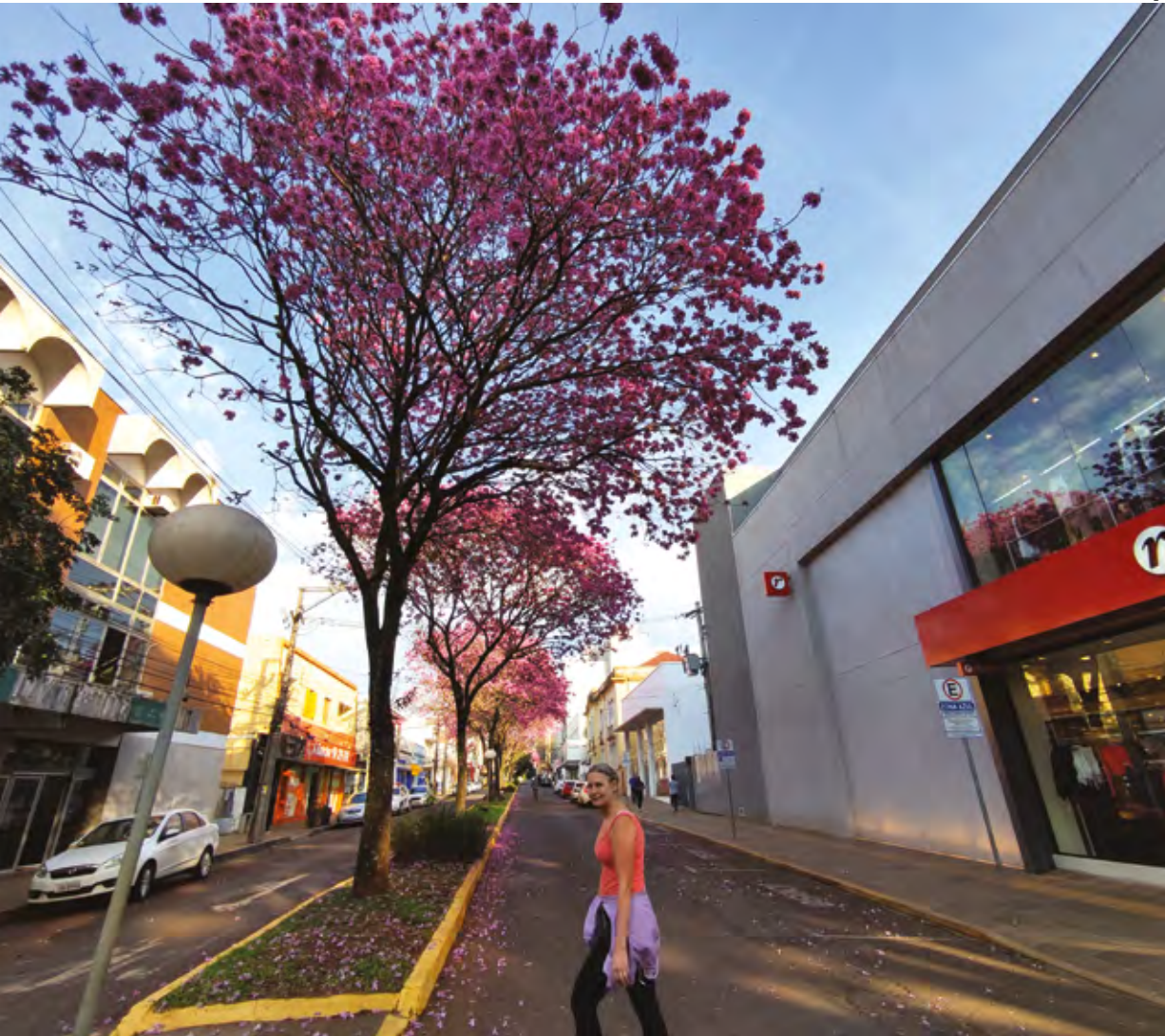
Rua Três de Outubro no centro de Santo Ângelo, RS.