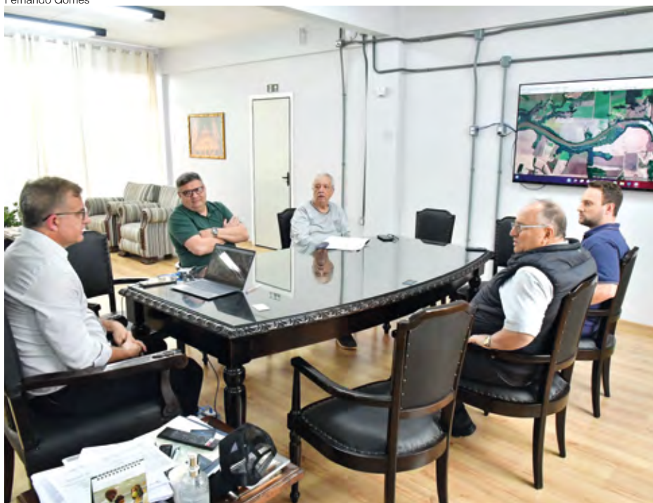
Central Geradora Hidrelétrica será construída no Rio Ijuí, na Esquina Gaúcha, em território santo-angelense