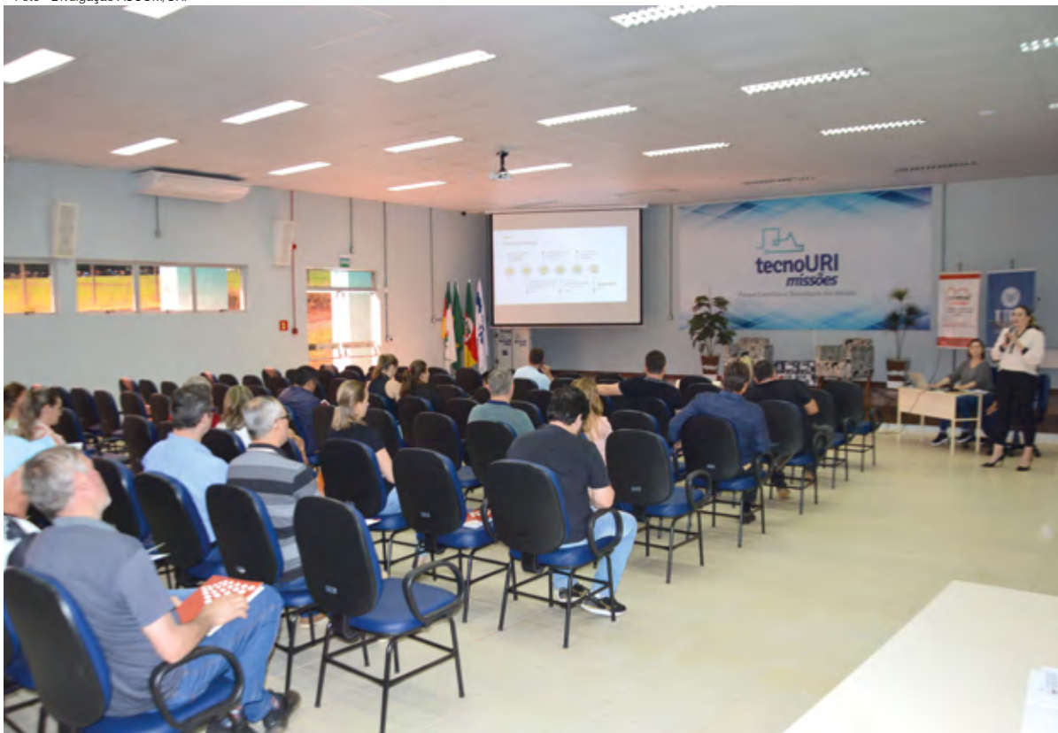
Auditório da TecnoURI Missões onde a reunião regional do COREDE Missões foi realizada

Serão destinados R$ 50 milhões para os 28 Conselhos Regionais de Desenvolvimento (Coredes), de cada região. Neste ano haverá ainda um plus de mais R$ 5 milhões para os nove Coredes com maior número de votação, sendo R$ 1 milhão para o Corede que ficar em primeiro lugar e R$ 500 mil reais para o que se posicionarem entre o segundo ao nono lugar.