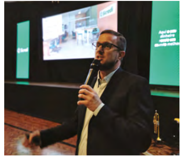
Presidente da União RS/ES Sidnei Strejevitch

presença da cooperativa nos 61 municípios. Trouxe detalhes sobre a chegada da Sicredi no Estado do Espírito Santo ao inaugurar duas unidades e mais um escritório de negócios naquele estado – em Cachoeiro do Itapeiririm e em Marataízes -. O presidente ainda valorizou os novos espaços e os projetos de qualificação das agências de Santo Ângelo, Santa Rosa, Santo Cristo, Entre-Ijuís e São Borja. Entre eles os que já estão inaugurados e os em fase de obras com previsão de inauguração em 2022 e 2023. Esclareceu sobre os programas de distribuição dos resultados e de ação social como o “Fundo Social”, “União Faz a Vida”, “Cooperação na Ponta do Lápis”, Educação financeira nas escolas, entre outros,