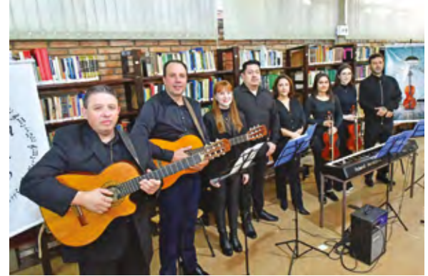
O evento foi encerrado com a apresentação da Cameratta Archangellus