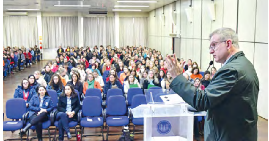
O encontro foi realizado no auditório da URI - Campus Santo Ângelo

O Governo Municipal e o CRR TEAcolhe de Santo Ângelo realizaram na tarde da última terça-feira (09), no auditório do Prédio 13 da URI Santo Ângelo, o segundo matriciamento com profissionais da Saúde, Educação e Assistência Social da região das Missões, que contou com a presença de 460 pessoas.