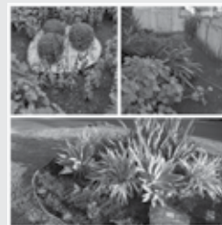
20/06/2022 - Comissão do Meio Ambiente fez a limpeza de nossa rótula entre, a rua Tiradentes e avenida Getúlio Vargas e do Jardim de nossa Casa Lions.