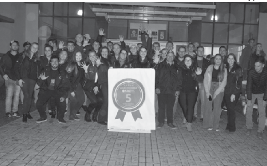
Implantado em 2016, o curso graduou duas turmas: em 2020 e em 2021

Após processo avaliativo que inclui entrega de documentação, contatos, comprovação de dados fornecidos, e vistoria de 20 a 22 de junho, o MEC- Ministério da Educação e Cultura divulgou esta semana o resultado oficial referente ao curso de graduação em Agronomia da URI Santo Ângelo: 5, a nota máxima.