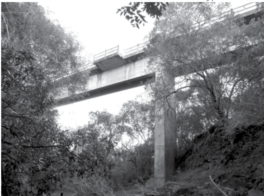
Ramal Ferroviário de Santo Ângelo - Ponte sob o rio São João