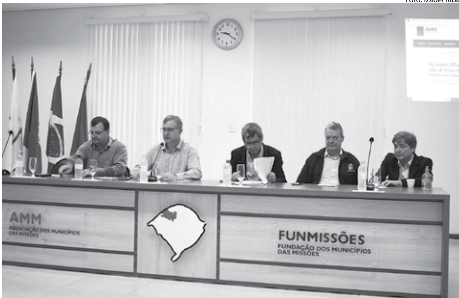
Sede da AMM - em Cerro Largo

A Associação dos Municípios das Missões (AMM) realizou a sua Assembleia Geral Ordinária do mês de julho na sexta-feira, 22, na sede da entidade em Cerro Largo, atualizando as pautas regionais em relação às rodovias, os voos a São Paulo a partir de outubro e a Ponte Internacional ligando Porto Xavier, no Brasil a San Javier, na Argentina.