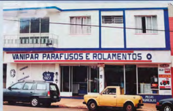
Primeira estrutura, matriz na Rua 25 de Julho, 279, em Santo Ângelo

Vanipar desde 1992 trabalhando para auxiliar nas necessidades dos clientes com o melhor atendimento e produtos de qualidade