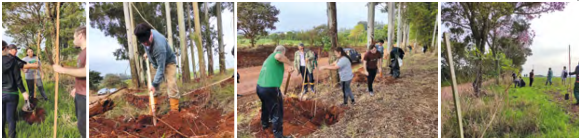
Voluntários e servidores públicos realizam o plantio de árvore na estrada de acesso a zona rural de Santo Ângelo

O Túnel Verde já possui uma extensão de quatro quilômetros. Nele, diversas espécies de árvores produzem um efeito sensorial e ecológico e todos os anos o plantio se amplia ou mantém esta ação que é liderada pela ARFOM – Associação de Reflorestamento de Santo Ângelo. Estima-se que já tenha alcançado a marca de quatro mil árvores e na última quinta-feira, dia 21, mais 70 mudas estão compondo o local, incluindo espécies com canafistulas, abacateiros, butiazeiros e mangueiras.