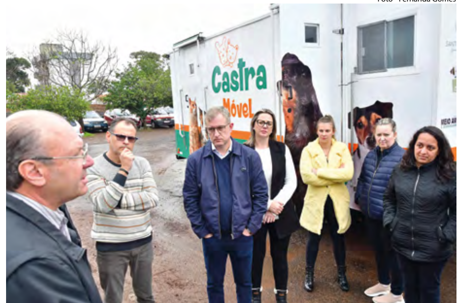
Visita técnica da URI