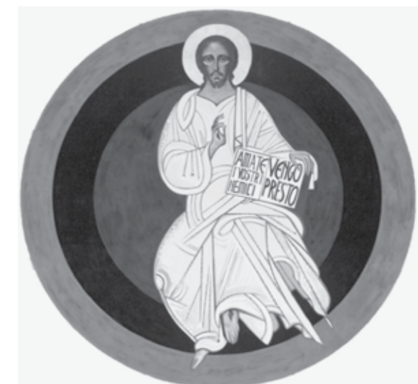
Imagem que identifica a edição 2022 do “Encontro Vocacional Caminho Neocatecumenal” em Foz do Iguaçu