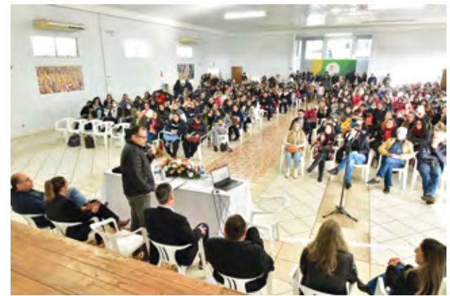
A solenidade foi realizada no Auditório Iglheno Burtet no Parque de Exposições Siegfried Ritter - Texto: Hogue Dorneles