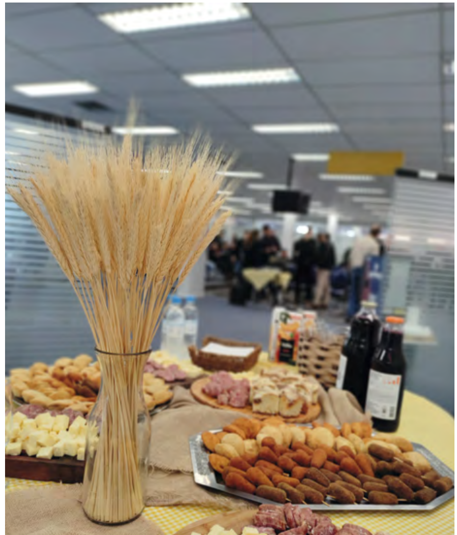
Queijo, salame, cuca, sucos foram adquiridos da Associação de Produtores Hortigranjeiros e Produtos Coloniais de Santo Ângelo (APROCOHSA)