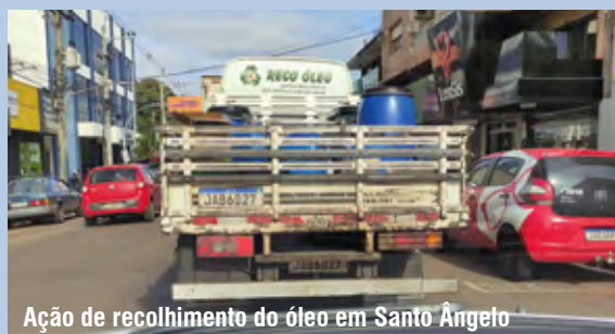
Ação de recolhimento do óleo em Santo Ângelo

Óleo saturado de fritura usado em aproximadamente 40 estabelecimentos localizados em Santo Ângelo e o óleo doméstico deixado em dois pontos de recolhimento implantados no município é transformado em sabão artesanal e em agente desmoldante de artefatos de concreto para a construção civil. Essa transformação e trabalho de coleta é realizado pela Reco Óleo, empresa licenciada para esta atividade e com sede na cidade de Horizontina.