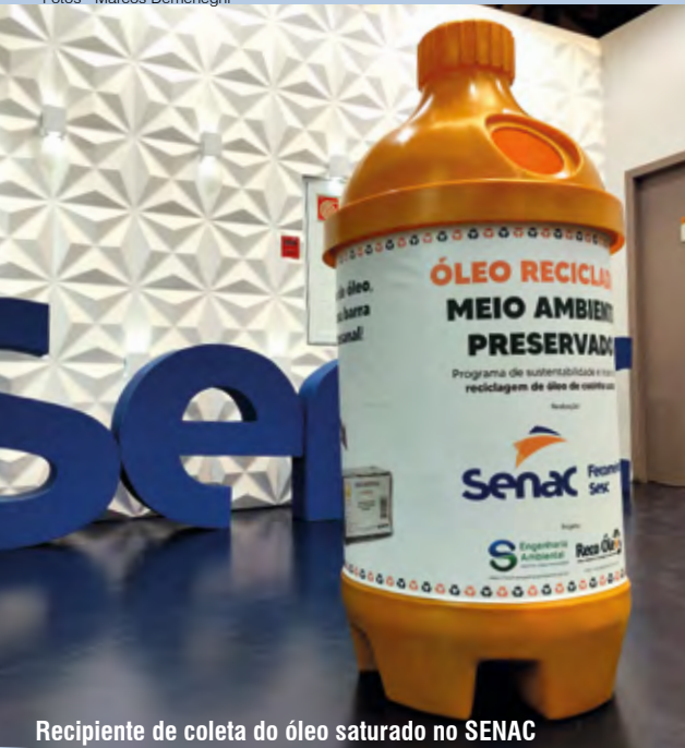
Recipiente de coleta do óleo saturado no SENAC