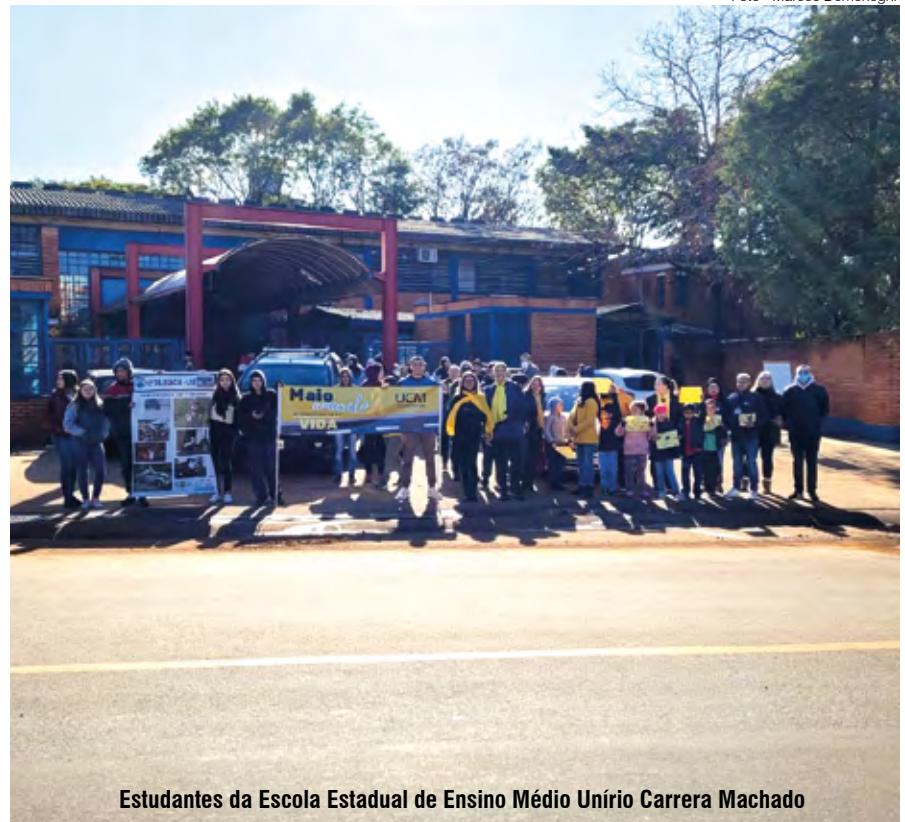
Estudantes da Escola Estadual de Ensino Médio Unírio Carrera Machado