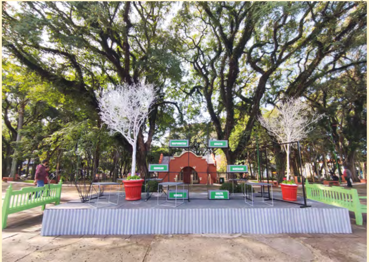
Estrutura elaborada pela equipe da Secretaria Municipal do Meio Ambiente de Santo Ângelo – Praça Ricardo Leônidas Ribas

Uma das ações que está associada ao tema é o recolhimento de resíduos recicláveis que será realizada pela Cooperativa Ecos do Verde no dia 17 de junho. Inicialmente programada para este final de semana, foi transferida para o dia 17, pois existe a possibilidade de chuva. Será na Praça Ricardo Le-