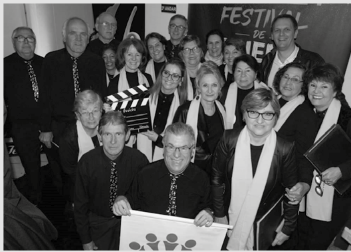
Os ensaios do Voz das Missões são realizados na Sede Social da AABB Santo Ângelo

O Coral Voz das Missões, da AABB Santo Ângelo, participa neste sábado, dia 30 do XVIII Encontro de Coros de AABBs do Rio Grande do Sul. O evento será realizado na cidade de Canoas (RS) e contará com a participação de grupos de 12 cidades diferentes.