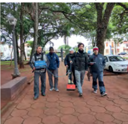
Largo da Praça Pinheiro Machado