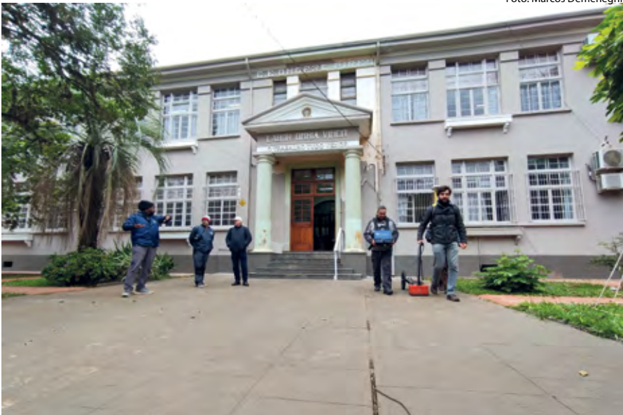
Investigação em Frente ao Colégio Onofre Pires