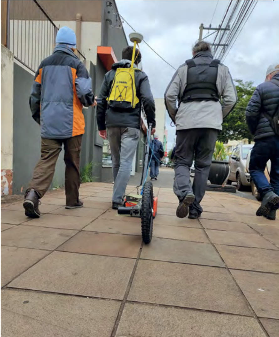
Pesquisadores usan o georradar na Rua Marques do Herval