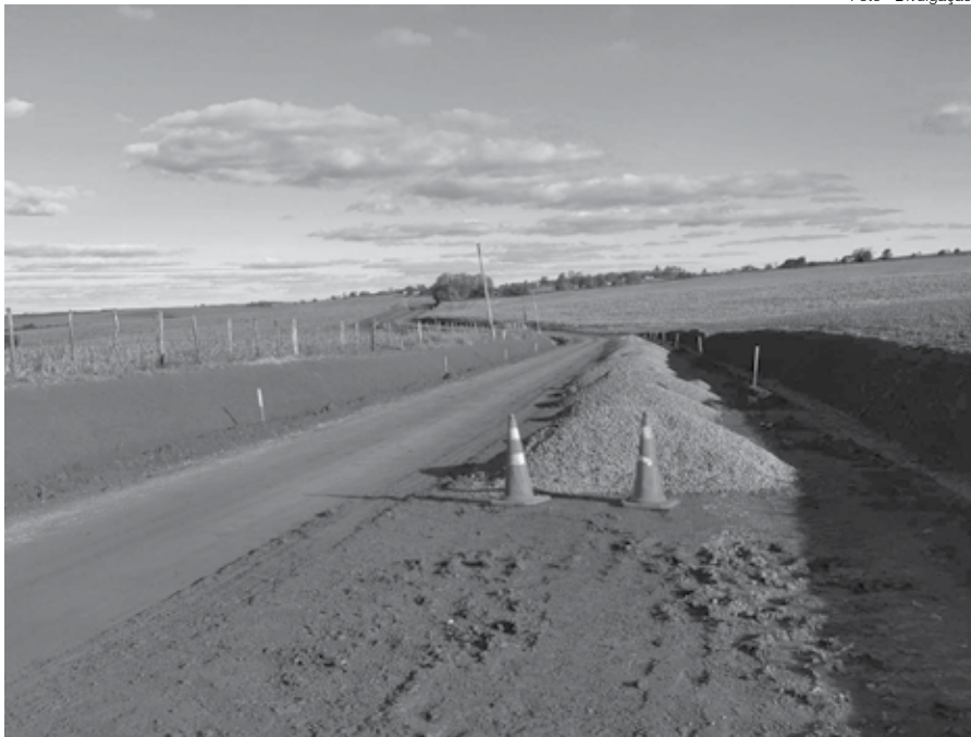
Obras na estrada Antonio Sepp (acesso as Ruínas de São João Batista)