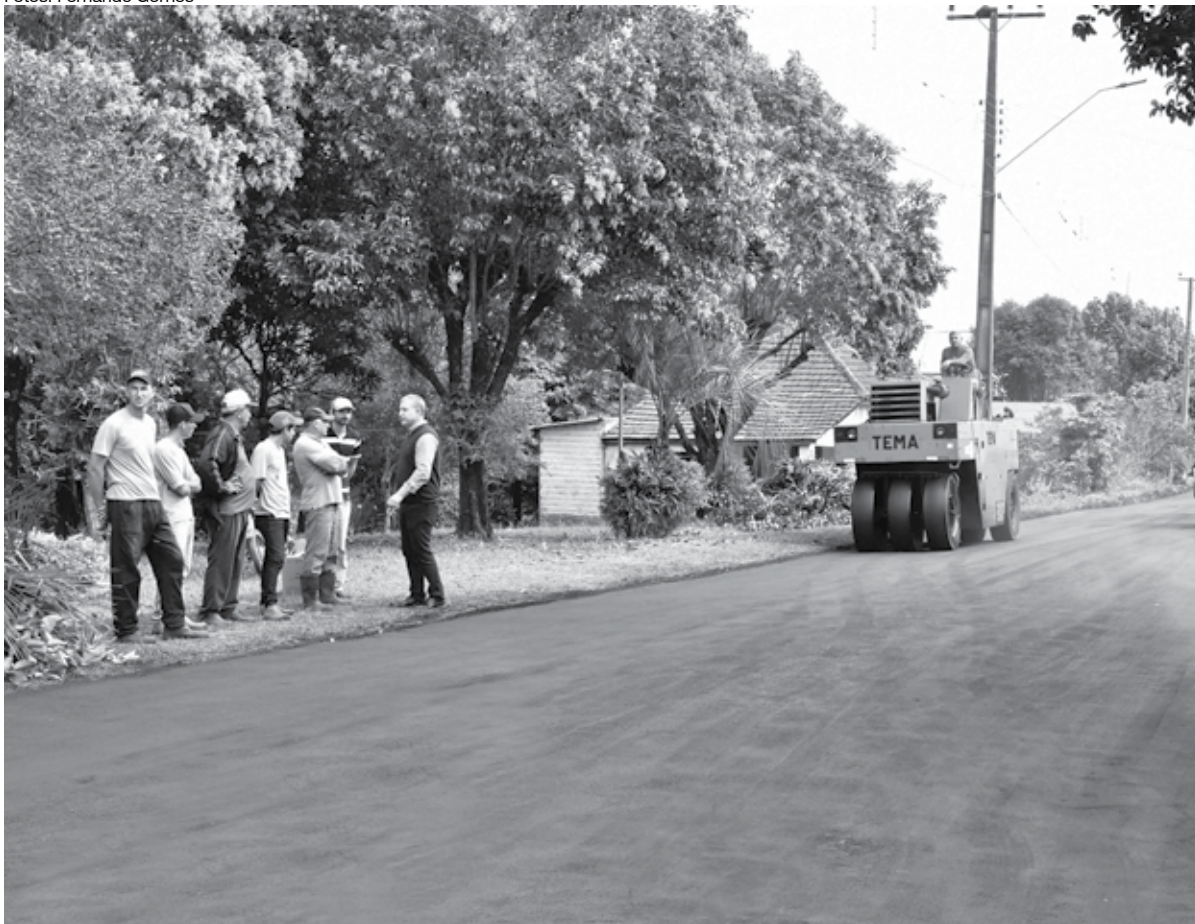
Pavimentação asfáltica na zona rural de Santo Ângelo

O Governo Municipal, por meio da Secretaria de Meio Ambiente e Desenvolvimento Urbano, está investindo R$ 182 mil na sede do Distrito Lajeado do Cerne, com o asfaltamento de cerca de 450 metros, a modernização do sistema de iluminação do ginásio, com a substituição das lâmpadas de alta pressão por tecnologia LED, e outras melhorias.