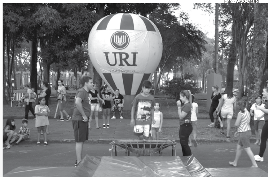
Atividades realizadas na Rua de Lazer de anos anteriores

São patrocinadores da Rua de Lazer: Raia 3, Garra Personal Studio, Vencal Calçados, Rotary Cruz de Lorena, URI – Campus Santo Ângelo, Serikraft – Materiais Serigráficos e Comunicação Visual, Escola de Educação Infantil Cascotito, ASR – Futsal, CER – Comunidade Cristã e Casa da Prevenção.