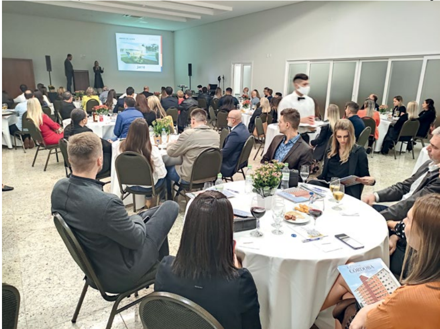
Pessoas ligadas ao setor imobiliário de várias cidades da região no evento de lançamento