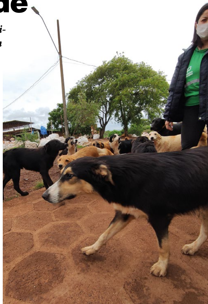
Eng. Ambiental Flávia Tomazi com os cães que vivem no local