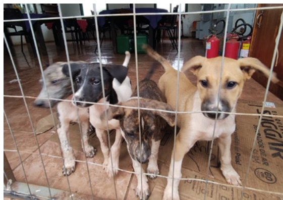
Filhotes que ainda não foram adotados