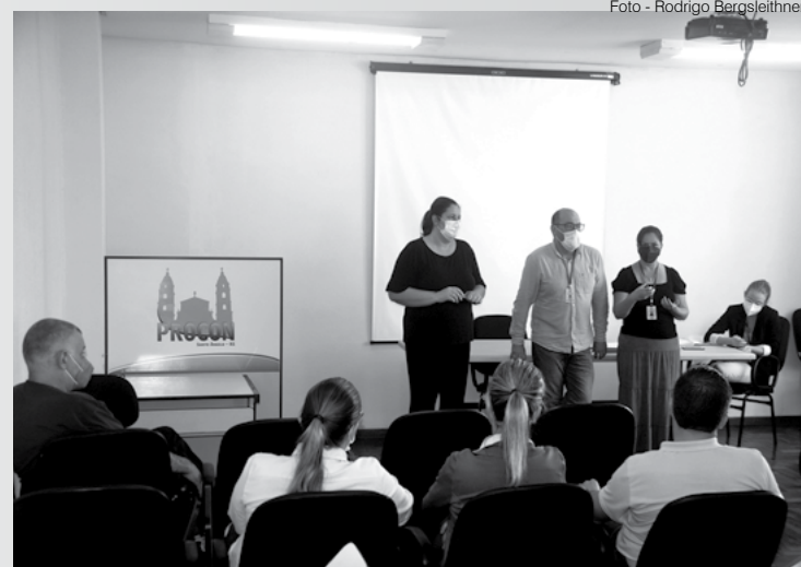
Representantes das vigilâncias Sanitária e Epidemiológica, estiveram reunidos com agentes da UPA 24 Horas e hospitais Santo Ângelo e Unimed Missões para debater a pauta