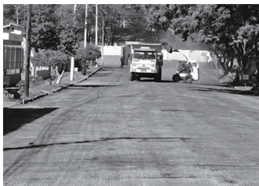
Rua Borges de Medeiros

A obra da rua Borges de Medeiros atende uma reivindicação de mais de 40 anos de moradores e empresários