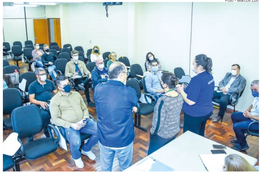
Reunião no Auditório do PROCOM

O secretário acredita ainda que seja fundamental cada integrante do Comitê da Dengue reforçar junto a comunidade os aspectos preventivos. “É preciso que todos estejam em alerta para o combate à proliferação do mosquito Aedes aegypti , transmissor da Zika, Chikungunya e Dengue, doenças chamadas de arboviroses, por isso várias ações estão sendo tomadas a fim de intensificar e implementar medidas de prevenção e controle.