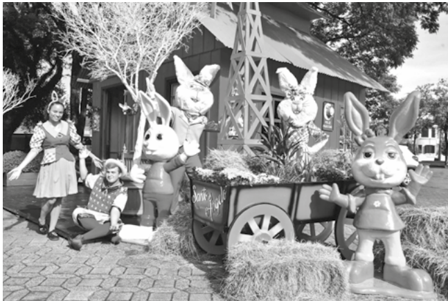
Vila do Coelho montada na praça Pinheiro Machado

Até o domingo de páscoa o cotidiano da Praça Pinheiro Machado ganha o impacto visual da Vila do Coelho. No largo em frente a Catedral, além da estrutura física montada, um casal de coelhos estará recebendo os visitantes, das 9 às 11 horas e das 14 às 19 horas. Várias escolas já estão agendando visitas de seus alunos ao local.