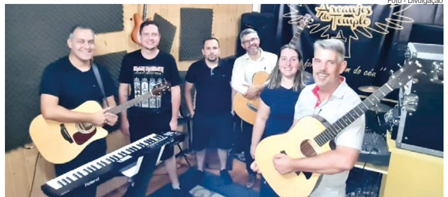
Banda Arcanjos do Templo

Expositores do Brique da Praça levam para o espaço uma seleção de produtos especiais neste domingo, dia 10, que antecede o domingo de páscoa. Além disso, a comissão de eventos agendou para o Show das Onze a participação da Banda Arcanjos do Templo.