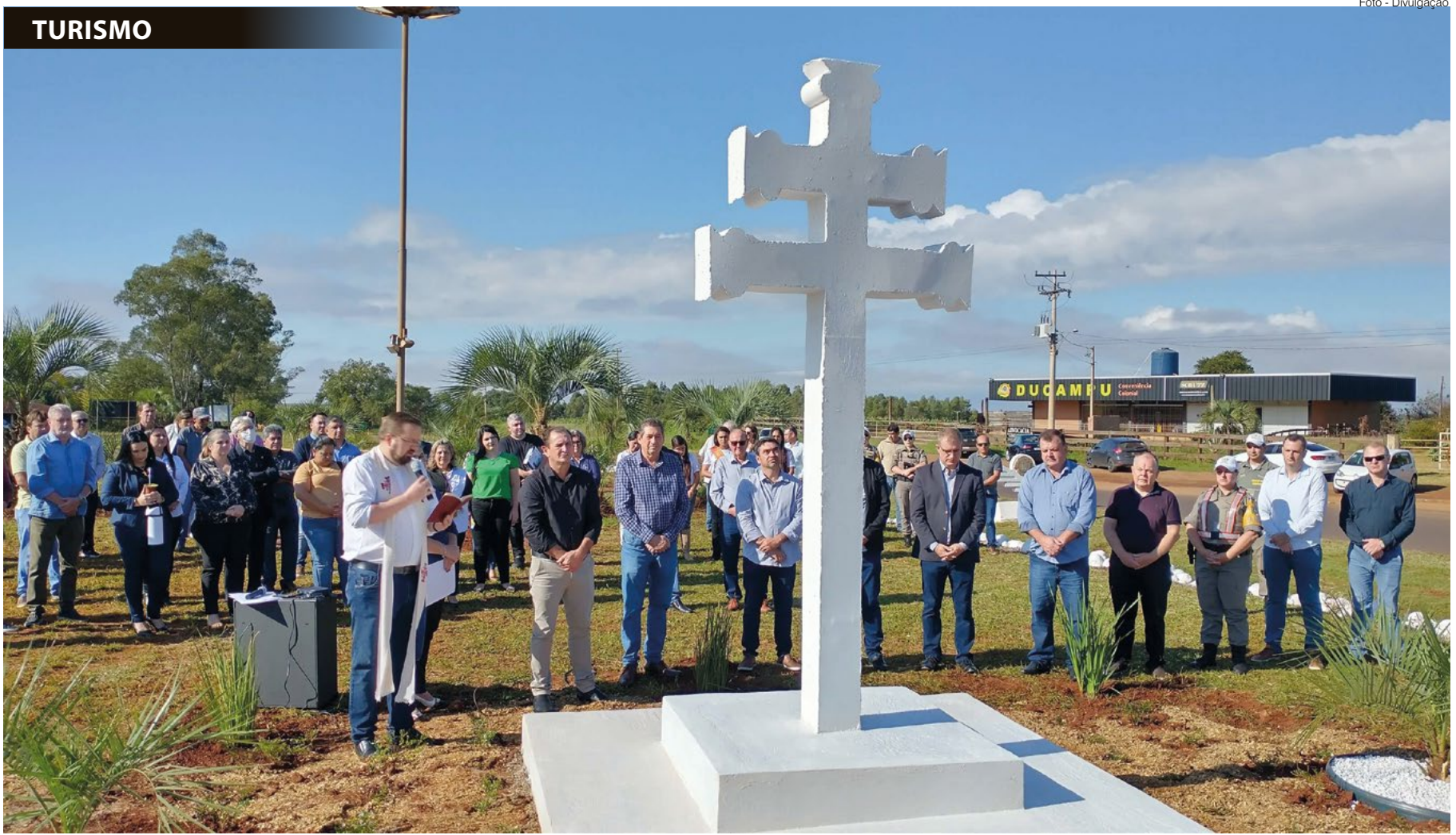
Trevo de acesso ao município de Giruá