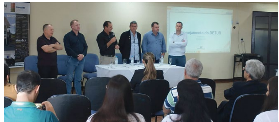
Reunião do DETUR realizado no Hotel Colinas

Logo após a bênção da cruz Missioneira foi realizado um encontro do Departamento de Turismo Funmissões (Detur), foi no auditório do Colinas Hotel com representantes dos 26 municípios que integram a Associação dos Municípios das Missões (AMM).