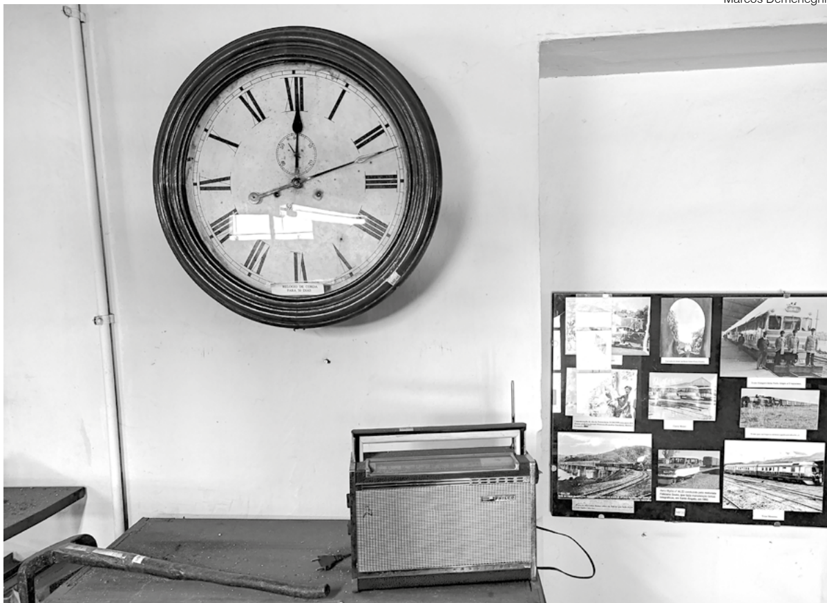
Peça do museu localizado na Estação Ferroviária de Santo Ângelo

Embora o relógio da foto não informe mais a hora certa, este objeto pode ser considerado uma das referências do tempo áureo do transporte ferroviário, por isso, integra o museu da antiga Estação Ferroviária de Santo Ângelo. A peça pode ser conhecida ao visitar este espaço que hoje integra o patrimônio cultural e material de Santo Ângelo.