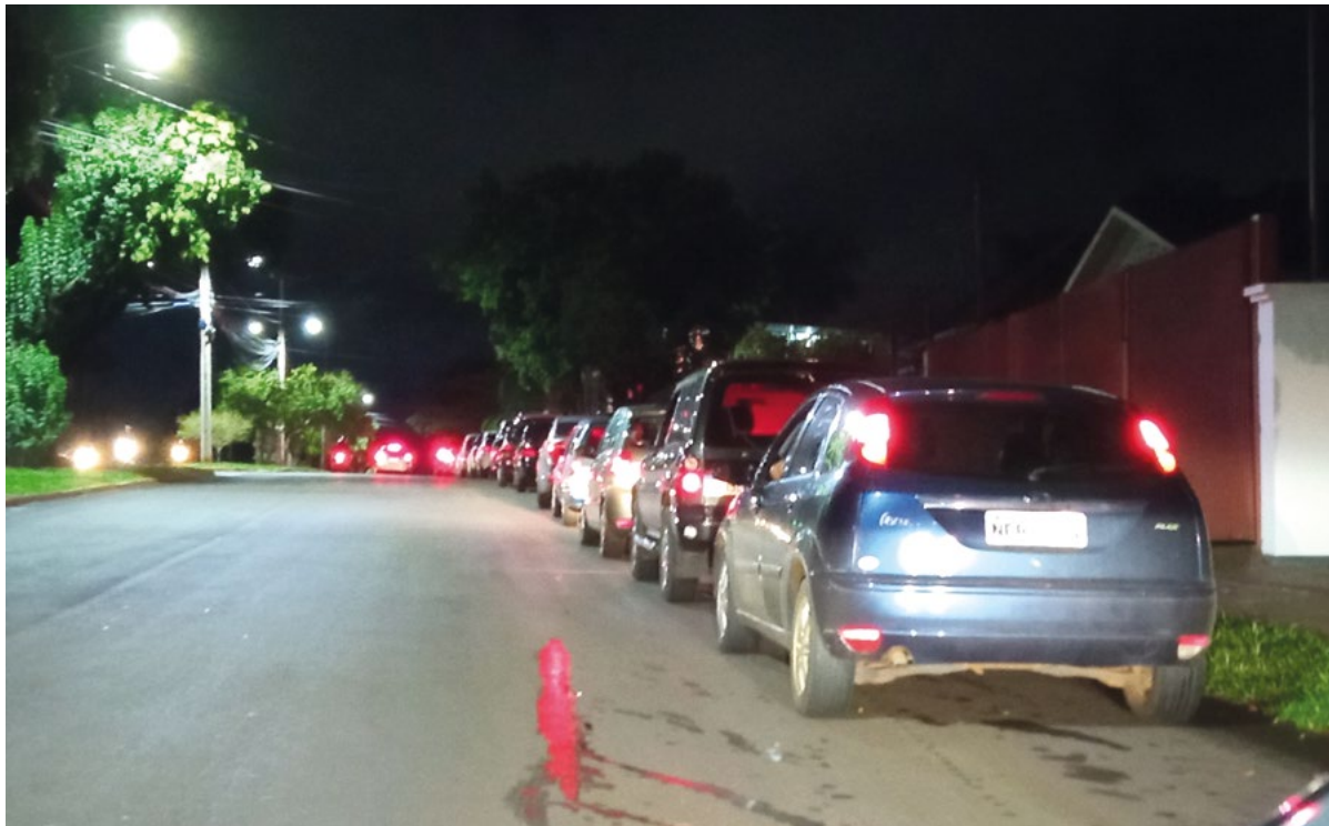
Automóveis esperam para abastecer em fila na Av. Getúlio Vargas

A corrida para encher o tanque ocorreu na quinta-feira, dia em que a Petrobras anunciou reajustes motivados pela alta internacional do Petróleo. Na sexta-feira, dia 11, os postos de combustíveis locais já praticavam preços reajustados e o preço novo do combustível já foi cobrado nas bombas.