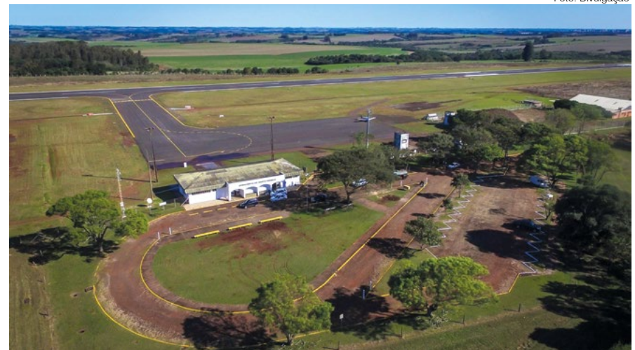
Vista aérea do atual terminal de embarque e desembarque do Aeroporto Sepé Tiaraju

cou que o Município tem se comprometido com responsabilidades que não são suas para que o cronograma seja atendido e os voos iniciem dentro do prazo anunciado. Entretanto, lembrou que não apenas na questão do Aeroporto, mas também em outros setores, citando a situação dos trevos das rodovias estaduais, o Município tem que se comprometer na realização das obras. “O DAER lançou na semana passada um programa com investimentos de R$ 350 milhões para obras