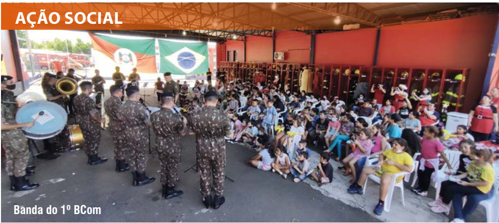
Banda do 1º BCom