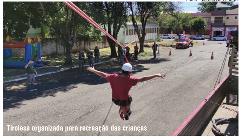
Tirolesa organizada para recreação das crianças