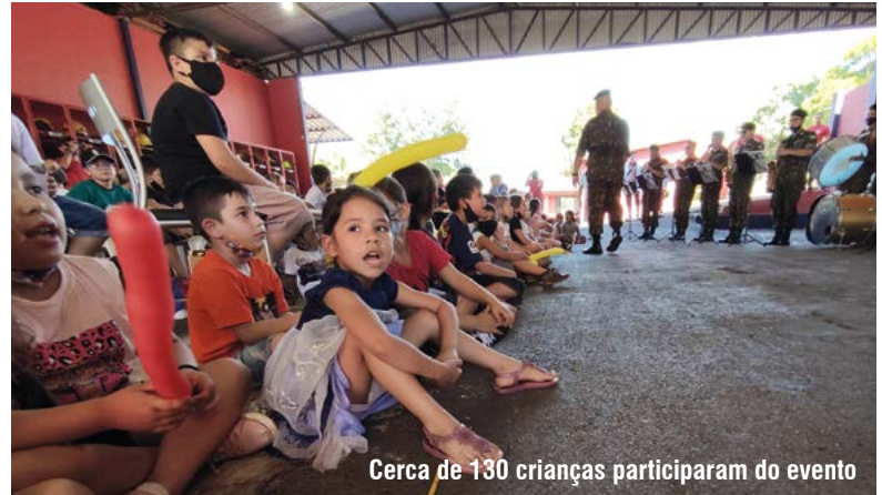
Cerca de 130 crianças participaram do evento

A Banda do 1º BCom interagiu e animou a festa das crianças durante a tarde. A Companhia Circense Burzum também contribuiu com atividades lúdicas, o Grupo de Escoteiros Medianeira esteve presente para ajudar na organização geral, uma dupla de animadores denominada Dr. Leleco e Soneca interagiu durante o evento. Também contribuíram voluntariamente com as atividades, o SESC, Banco do Brasil, Banrisul, Prefeitura de Santo Ângelo, Academia de dança, Clínica Odonto Excellence, Polícia Civil, Alibem, entre outros.