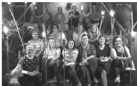
Homenagem de carinho e de saudade dos Companheiros, Companheiras, Domadores e Cônjuges do Lions Clube Santo Ângelo Universitário.

Lá, onde o começo e o fim de todas as coisas se encontram!