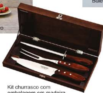
Kit churrasco com embalagem em madeira