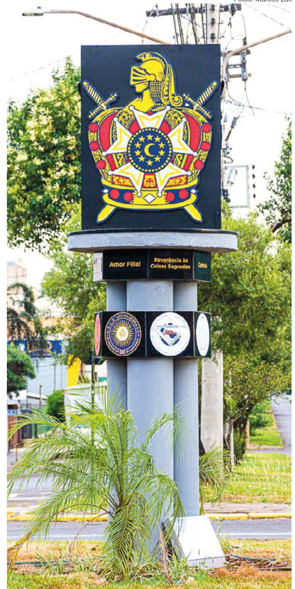
Monumento alusivo aos 25 anos da Ordem DeMolay em Santo Ângelo instalado na rótula localizada entre a Av. Getúlio Vargas e Av. Rio Grande do Sul

O Capítulo, sendo uma entidade privada de fins filantrópicos, para execução de seus projetos sociais, arrecada fundos através de doações e promoções de rifas, inclusive para execução do monumento.