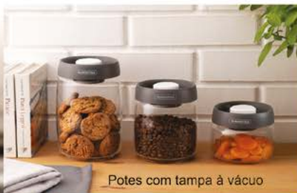
Potes com tampa à vácuo