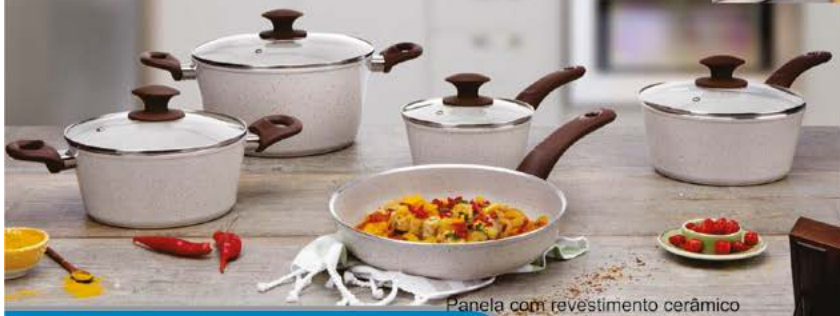
Panela com revestimento cerâmico