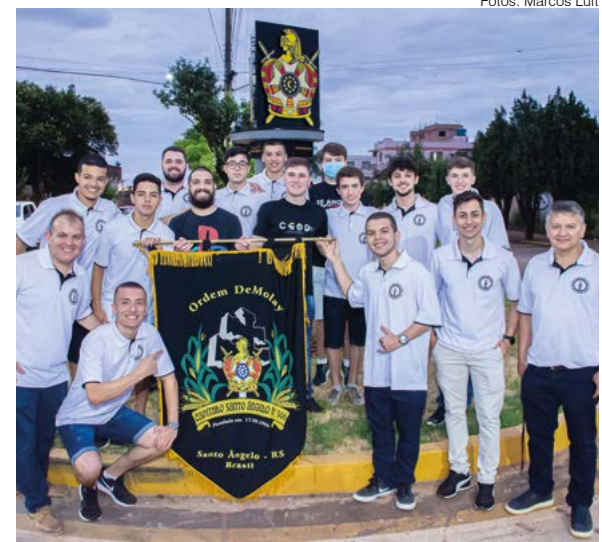
A Ordem DeMolay é composta por jovens do sexo masculino com idade entre 12 e 21 anos. O Capítulo Santo Ângelo, nº 306, foi fundado no dia 17 de agosto de 1996.