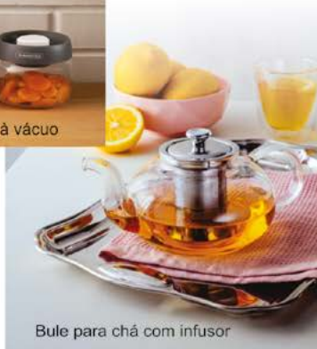
Bule para chá com infusor