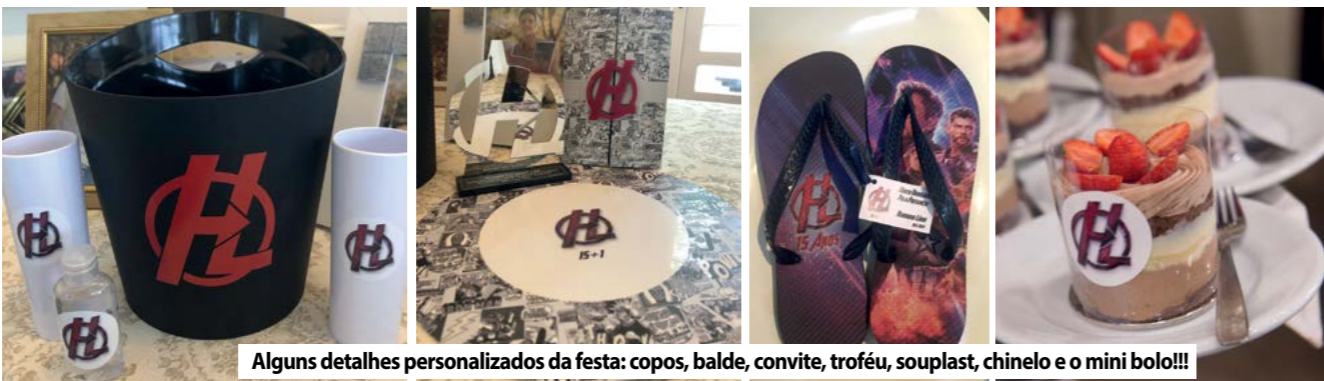
Alguns detalhes personalizados da festa: copos, balde, convite, troféu, souplast, chinelo e o mini bolo!!!