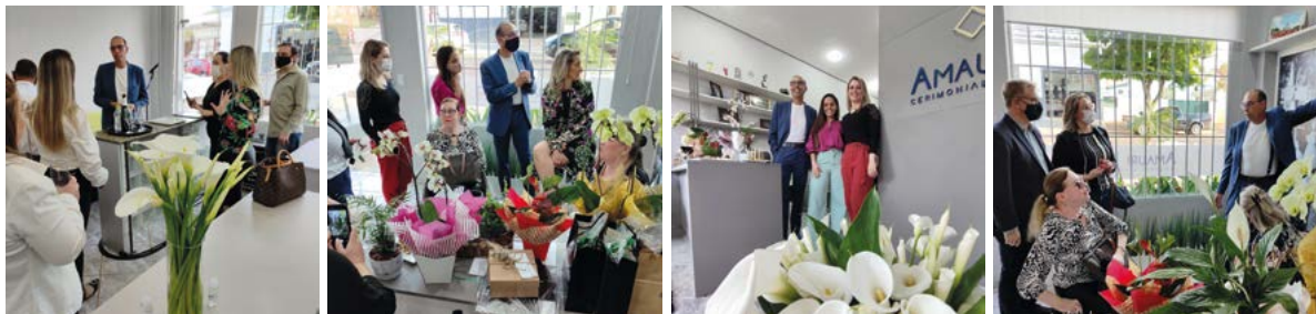
Durante o coquetel os visitantes aproveitaram para conhecer o novo espaço de trabalho, trouxeram flores e aproveitaram o ambiente informal para conversar e brindar o lado bom da vida