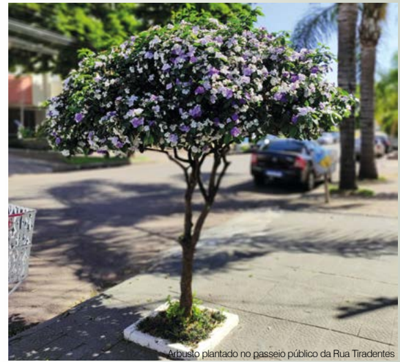
Arbusto plantado no passeio público da Rua Tiradentes

A primavera iniciou às 16h e 21min da última quarta-feira, dia 22 e observa-se que os vários manacás-de-cheiro plantados em área central de Santo Ângelo estão coloridos, indicando que é chegada a época de sua floração, comumente registrada entre os meses de setembro e outubro, quando inicia a primavera.