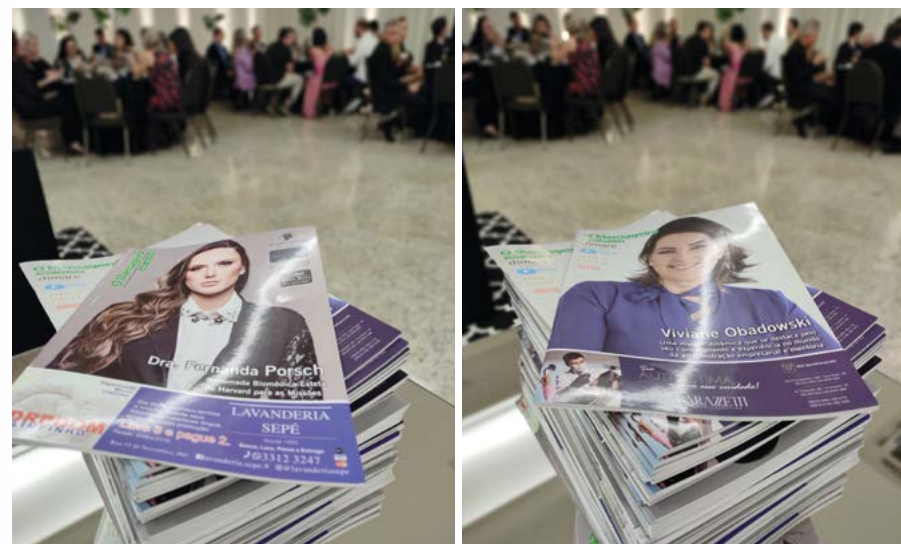
O material impresso foi entregue aos convidados e já estará circulando na região