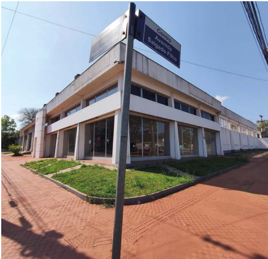
Entroncamento das Ruas Marechal Floriano e Salgado Filho

O espaço está localizado na zona norte da cidade, Av. Salgado Filho, esquina com a Rua Marechal Floriano e já está em obras