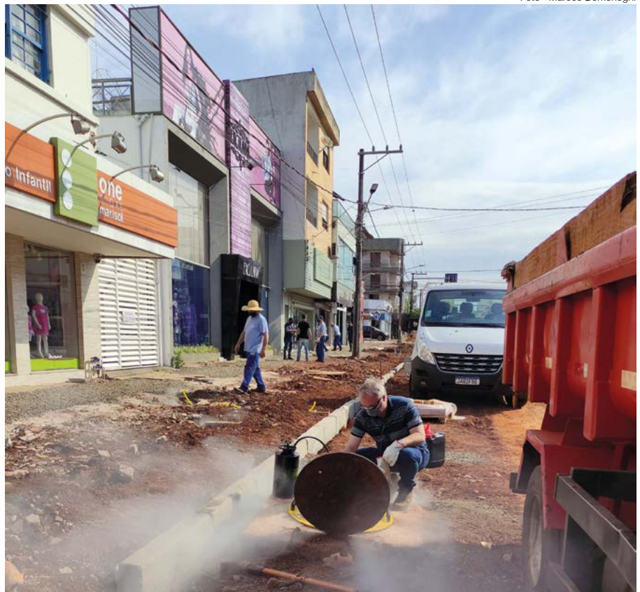
Solução de hidrocarbonetos é injetada na nova rede de esgoto