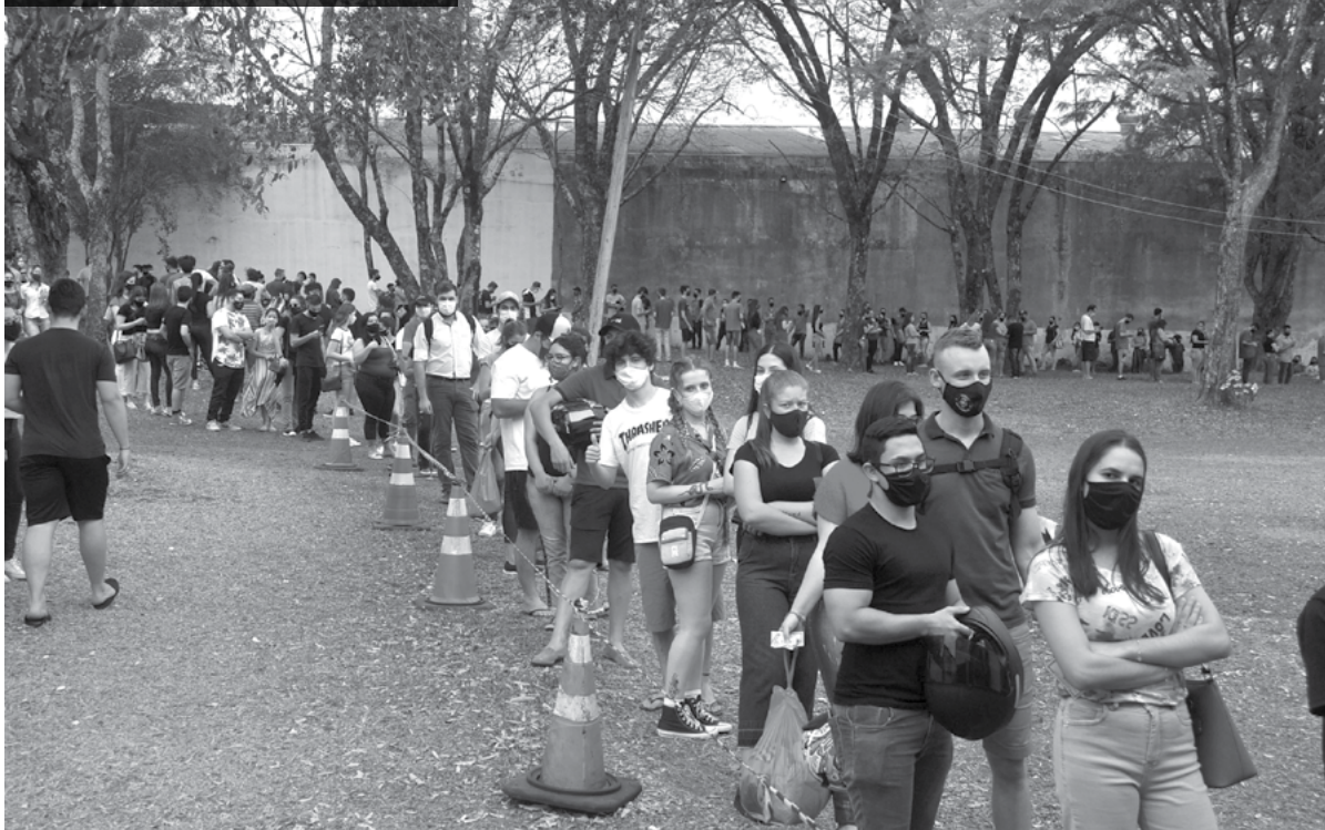
Fila de espera no CTG Os Legalistas