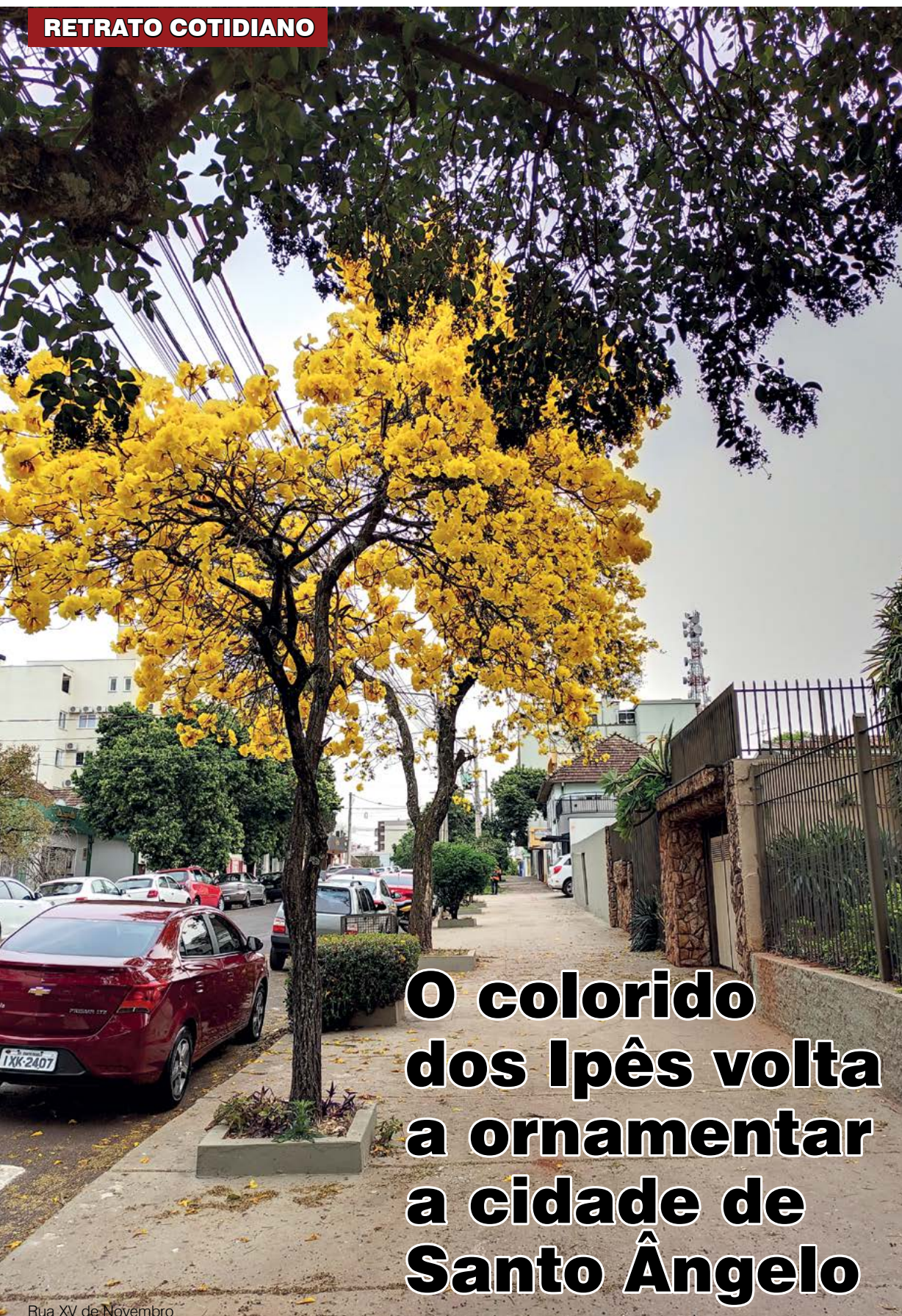
Rua XV de Novembro