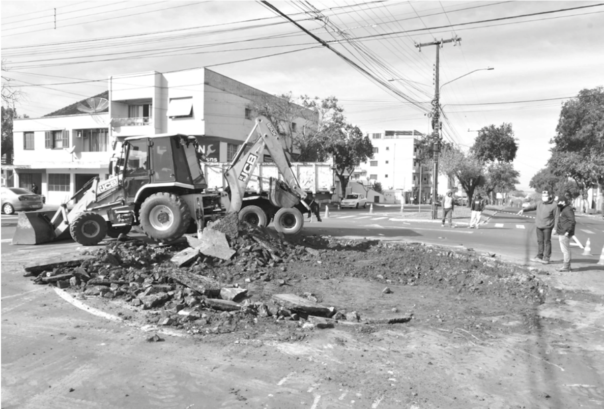
Maquinário da prefeitura iniciando a obra

A Secretaria Municipal de Meio Ambiente e Desenvolvimento Urbano está construindo uma rótula no cruzamento das avenidas Rio Grande do Sul e Getúlio Vargas, na Zona Sul de Santo Ângelo.