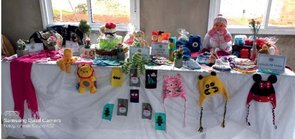
MAOS DE FADA