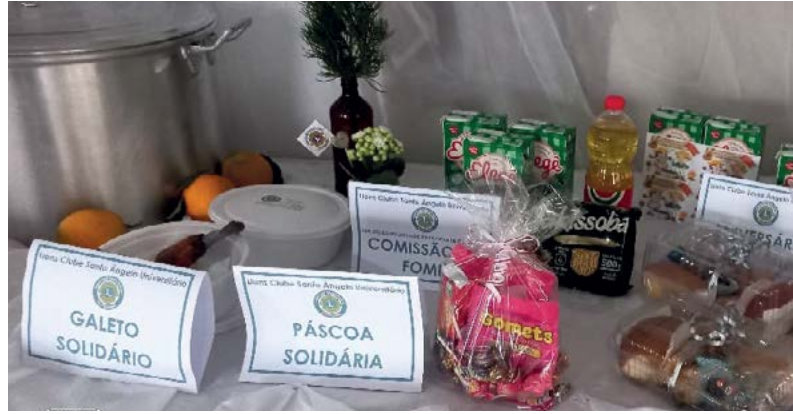
GALETO SOLIDÁRIO PÁSCOA SOLIDÁRIA