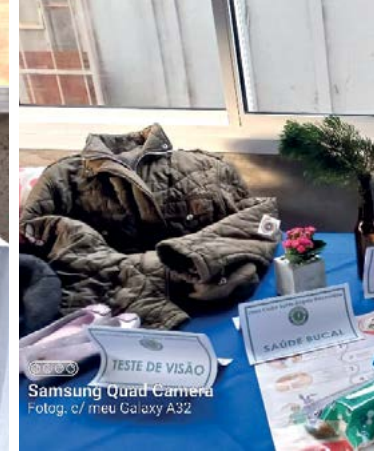
TESTE DE VISÃO SAÚDE BUCAL