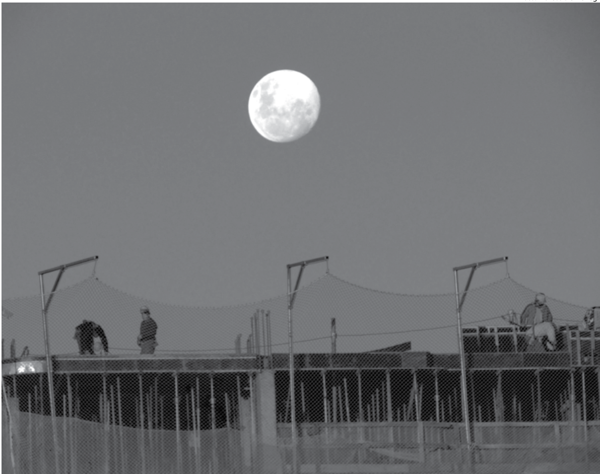
Obra de construção civil no centro de Santo Ângelo