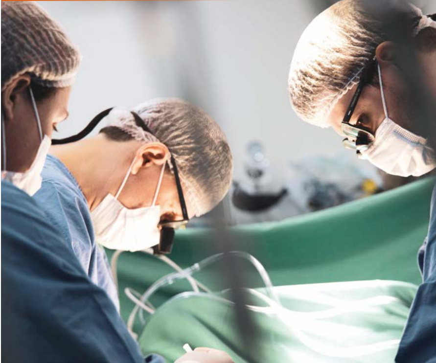
Cirurgia cardíaca de peito aberto com auxílio de circulação extracorpórea