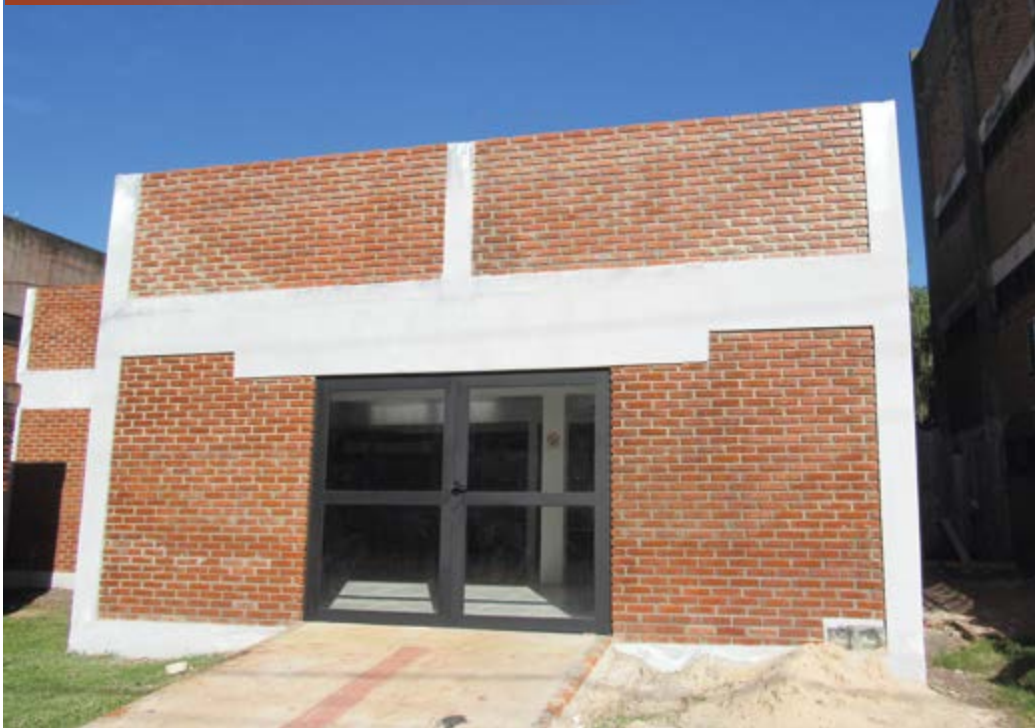
Nova sede da ASLE em fase de acabamentos