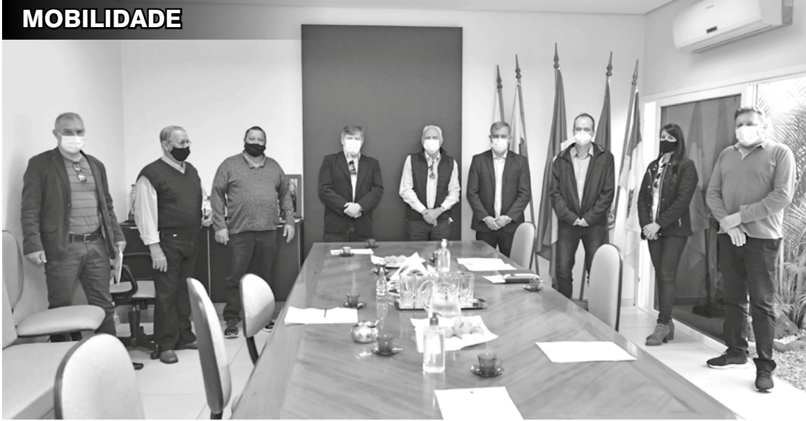
A posse foi na sede do Sindicato Rural