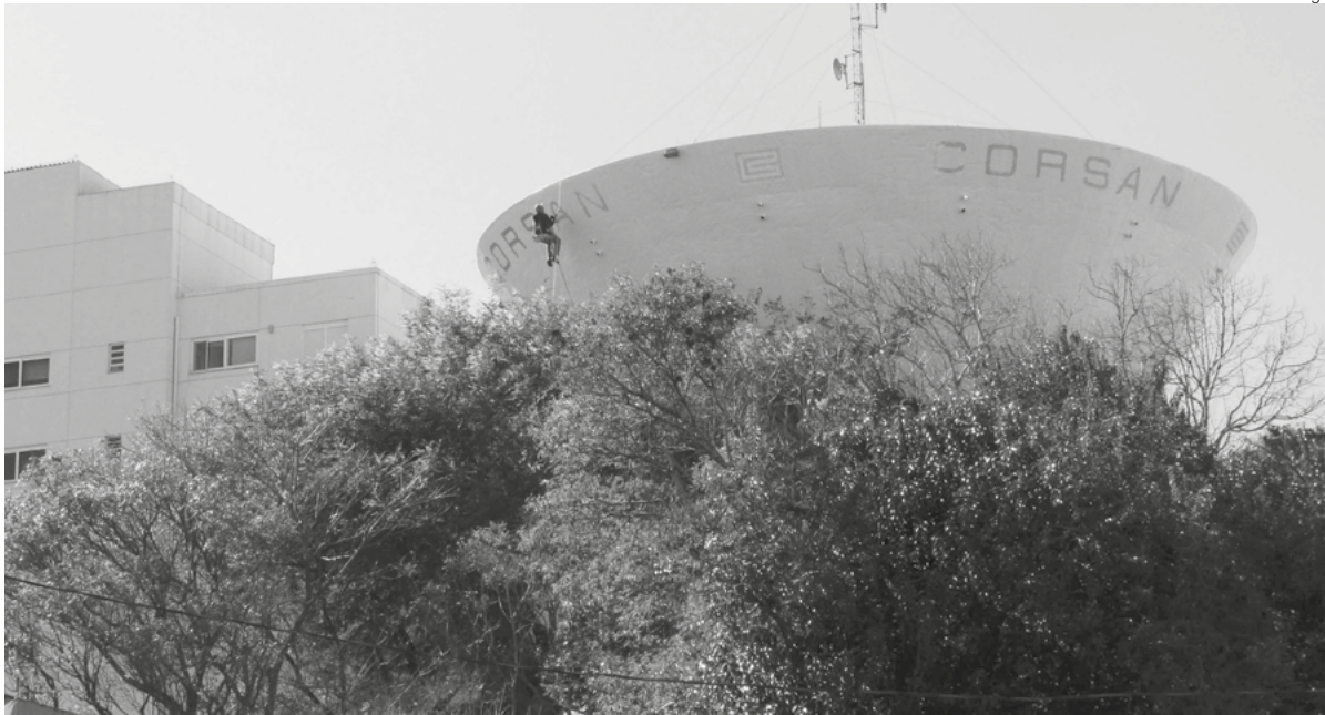
Reservatório de água pertencente ao sistema de abastecimento da CORSAN no centro de Santo Ângelo

O governo de Eduardo Leite pretende obter, com anuência dos deputados estaduais, autorização para privatizar a Corsan sem plebiscito, ou seja, sem consultar o Povo Gaúcho. Por este motivo, busca a aprovação da Proposta de Emenda a Constituição 280/2019. Na terça-feira, dia 29, obteve a vitória em primeiro turno com 34 votos favoráveis e 18 contrários.