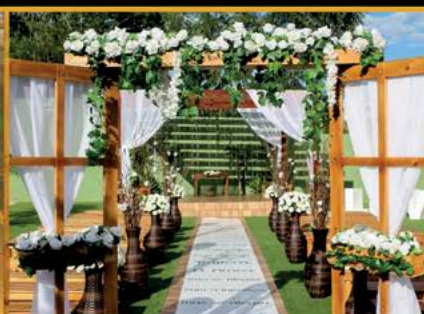
Espaço para Cerimônias ao Ar Livre