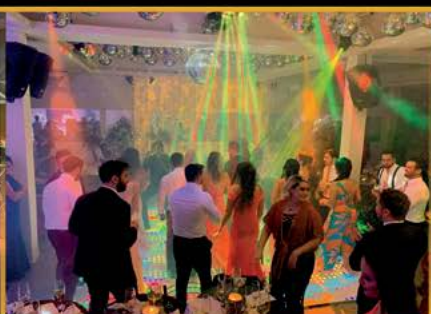
Pista de Dança