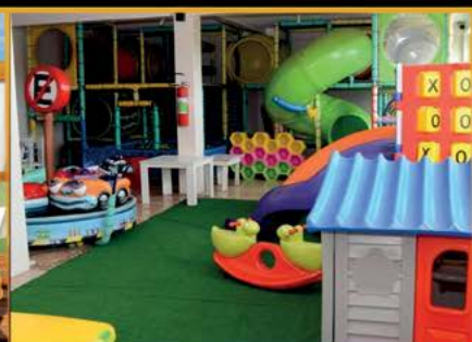
Kids Place Completo

Espaço Moderno, com o conforto que você merece!