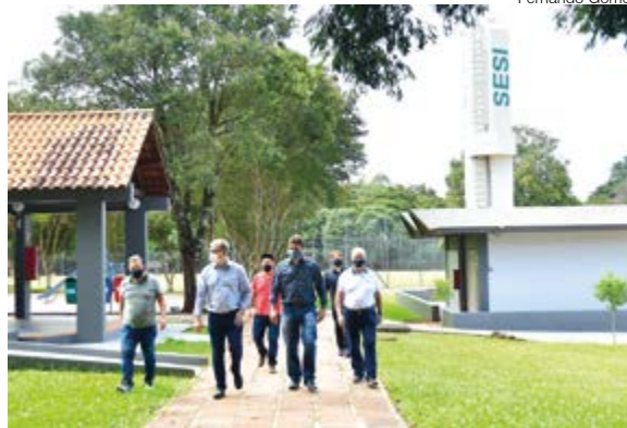
Prefeito e secretários visitam o SESI

O SESI anunciou o fechamento de unidades em vários municípios, entre eles, Santo Ângelo e Ijuí. As atividades nesses locais serão encerradas no dia 31 deste mês. Diante do quadro, o Governo Municipal de Santo Ângelo iniciou tratativas para assumir o Complexo de Lazer e Esporte localizado na Zona Norte.