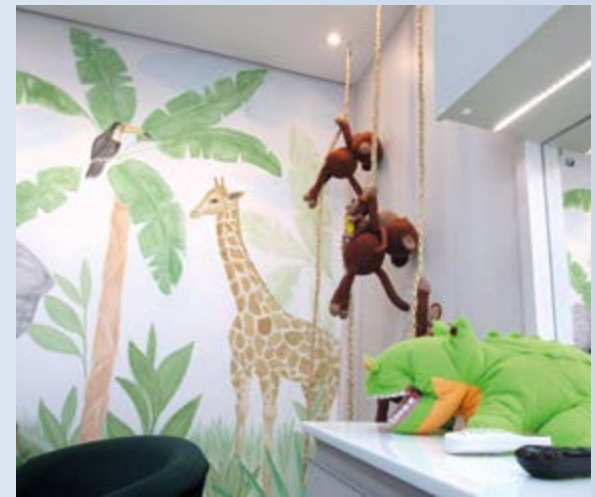
Um dos espaços decorados da odontopediatria