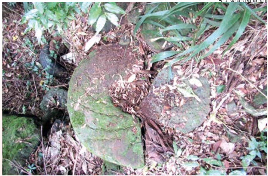
Meia pedra de moer cereais é encontrada pelo repórter do Mensageiro próxima da cascata do Itaquarinchim

O moinho antigo da família Pydd possuía um sistema composto por uma bica suspensa feita em madeira e as tradicionais rodas d'água que moviam