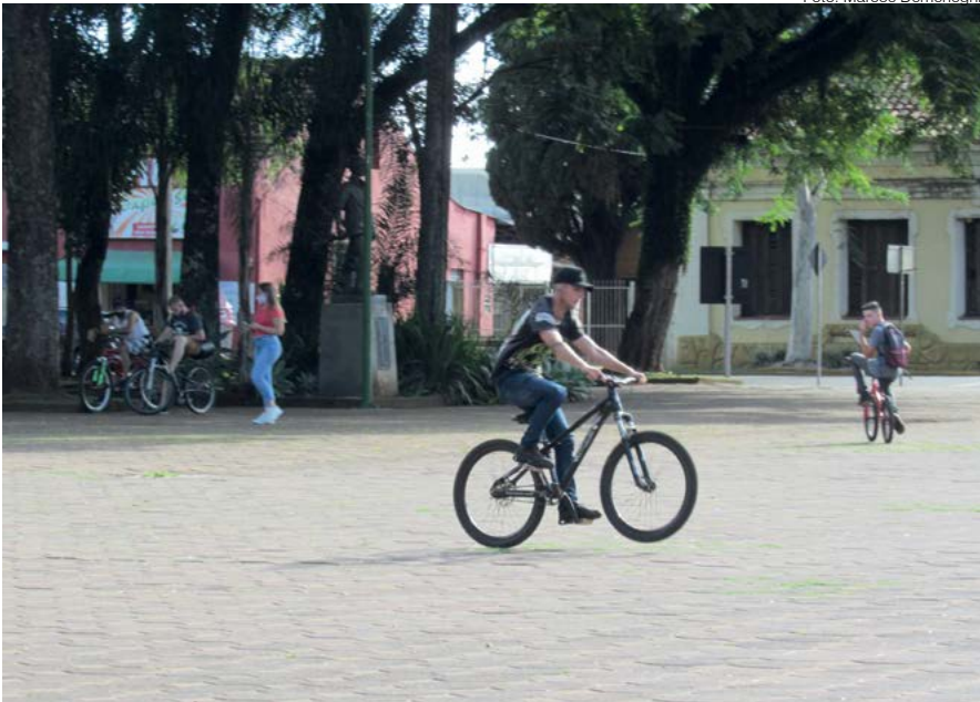
Jovens fazem uso recreativo de bicicletas no calçadão da Praça Pinheiro Machado

O espaço para os ciclistas é cada vez mais reduzido na zona central do município, pois as ruas não oferecem lugar seguro para esta opção de mobilidade urbana.