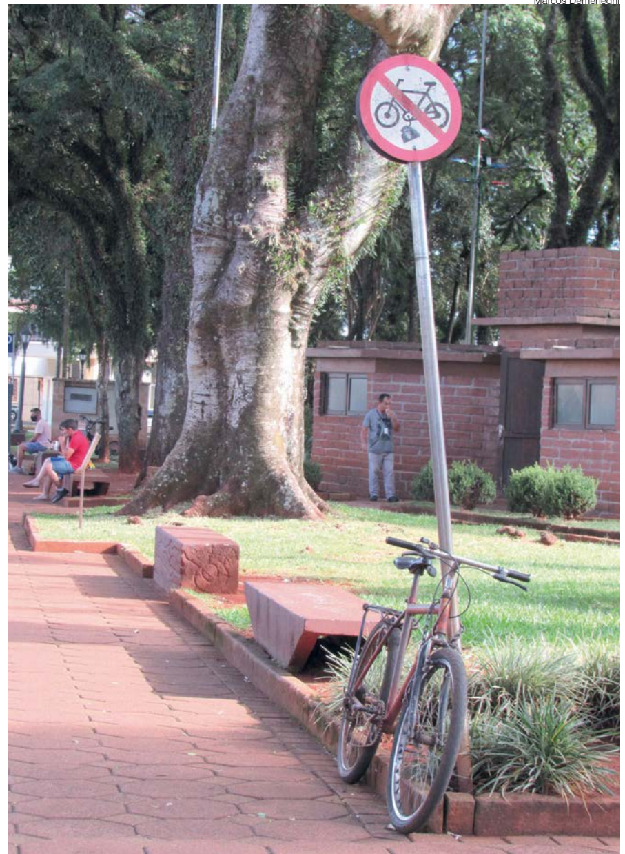
Bicicleta presa à placa de sinalização

Existe um único trecho feito exclusivamente para ciclistas em Santo Ângelo. Está na Av. Venâncio Aires compreendido entre as ruas Marques